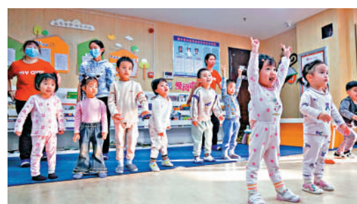
中國大力發展託幼一體服務。圖為小朋友在青島省西寧市「親子小屋」項目點內活動。

路透社指出，人口老齡化已成為中國國內越來越受關注的問題，預計到2035年，中國60歲以上的人口將增加至少40%，超過4億人，相當於英國和美