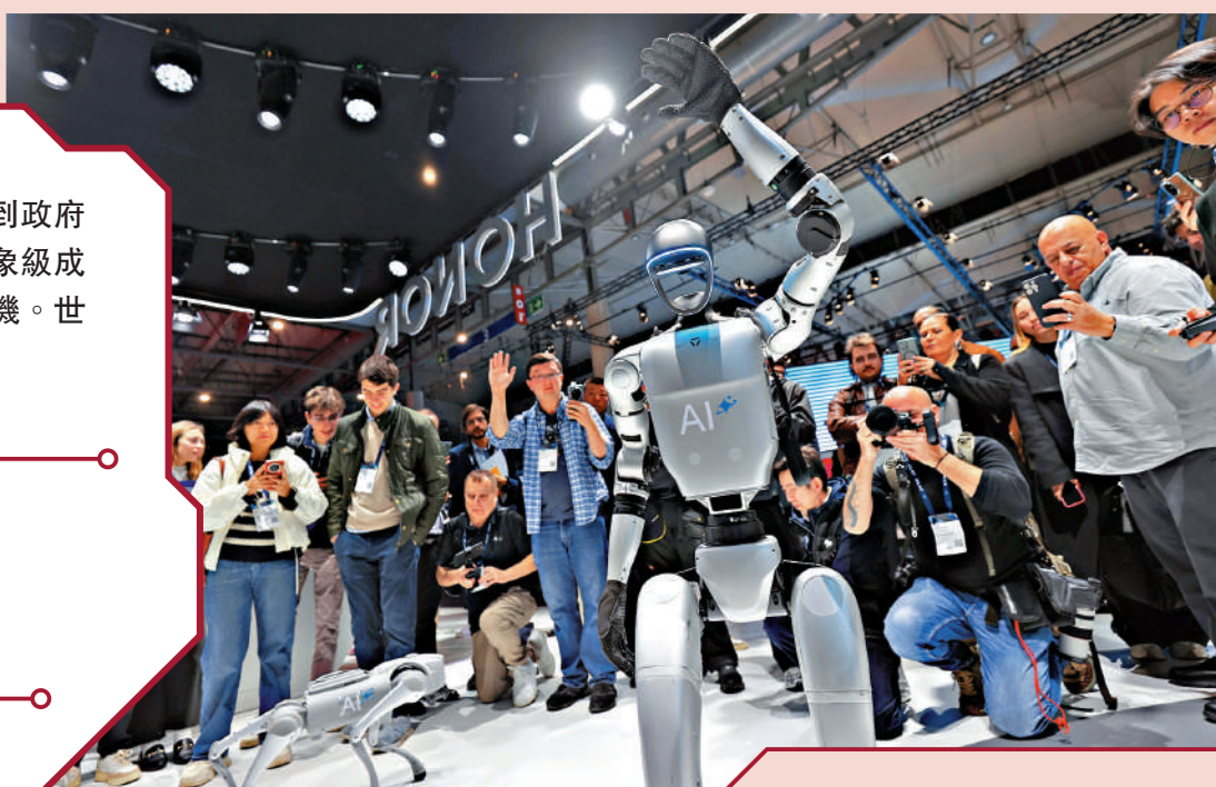
人形機器人等中國創新科技火遍全球。圖為在西班牙巴塞羅那舉行的世界移動通信大會上，觀眾在榮耀展區參觀拍攝展示機器人。

正在北京召開的中國全國兩會受到國際媒體和海外各界人士關注。從DeepSeek的一鳴驚人，到電影《哪吒2》票房奇跡震撼全球，從中國經濟在全球經濟遭遇逆風時繼續穩健發展，到政府以實實在在的幫扶措施完善社會保障、鼓勵生育……一件件現象級成就令世人目不暇接，展現着中國經濟社會發展向陽而興的蓬勃生機。世界期待通過中國兩會這個窗口，感知中國高質量發展的澎湃之勢。