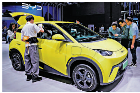
中國經濟在全球進一步發揮「穩定器」作用。圖為上海車展上展出的比亞迪海鷗電動汽車。

【大公報訊】綜合報道：美國特朗普政府對全球多國揮舞關稅大棒之際，國際觀察人士和外媒紛紛以「超出預期」、