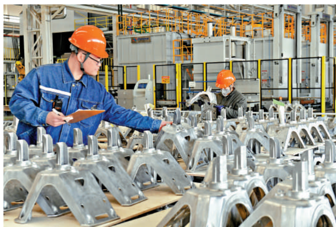
政府工作報告敦促落實促進民營經濟發展的政策措施。圖為工作人員在山東一間民營材料科技企業檢查精密鋁合金結構件。

韓國韓中城市友好協會會長權起植表示，全球正對美國特朗普政府奉行的以利益為中心的對外政策感到失望和不安，期待中國成為多邊主義國際秩序以及全球自由貿易秩序的維護者，「希望今年兩會能成為展現中國在經濟和對外政策方面領導力的重要平台」。