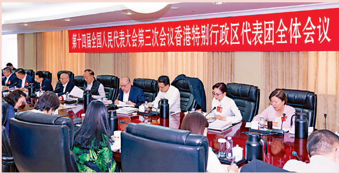
▶ 3月5日下午，全國人大代表、中央政府駐港聯絡辦主任鄭雁雄參加香港代表團全體會議。

【大公報訊】3月5日下午，十四屆全國人大三次會議香港代表團舉行全體會議，審議政府工作報告。17位港區全國人大代表踴躍發言，高度評價工作報告，並結合香港實際情況提出意見及建議。 全國人大代表、中央政府駐港聯絡辦主任鄭雁雄在參加審議時表示，聽了李強總理代表國務院作的政府工作報告，倍感振奮、備受鼓舞。報告總結成績實事求是，分析形勢科學精準，部署工作務實具體，體現了穩中求進工作總基調，突出了高質量發展根本要求，貫穿了改革創新精神實質，回應了人民群眾熱切期盼，是一個高舉旗幟、求真務實、凝心聚力的好報告。