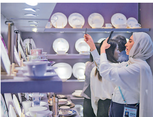
▲外國客商在2024年10月的廣交會上選購商品。

李強在報告中提出，穩定對外貿易發展。加大穩外貿政策力度，支持企業穩訂單拓市場。優化金融服務，擴大出口信用保險承保規模和覆蓋面。促進跨境電商發展，完善跨境寄