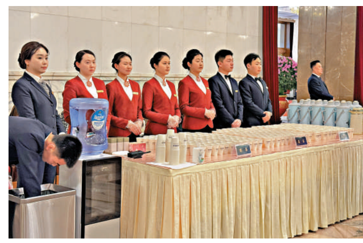
▲人民大會堂細心地提供茶水服務。