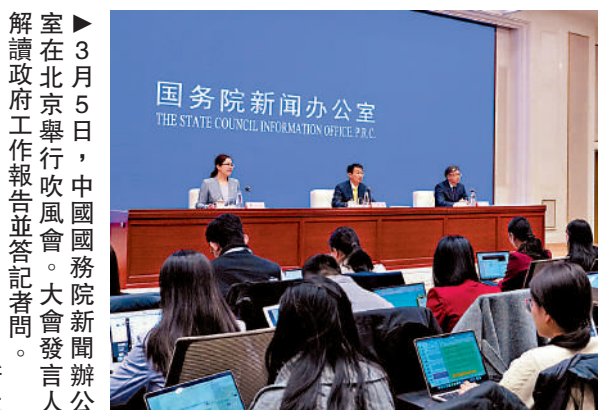
▲3月5日，中國國務院新聞辦公室在北京舉行吹風會。大會發言人解讀政府工作報告並答記者問。