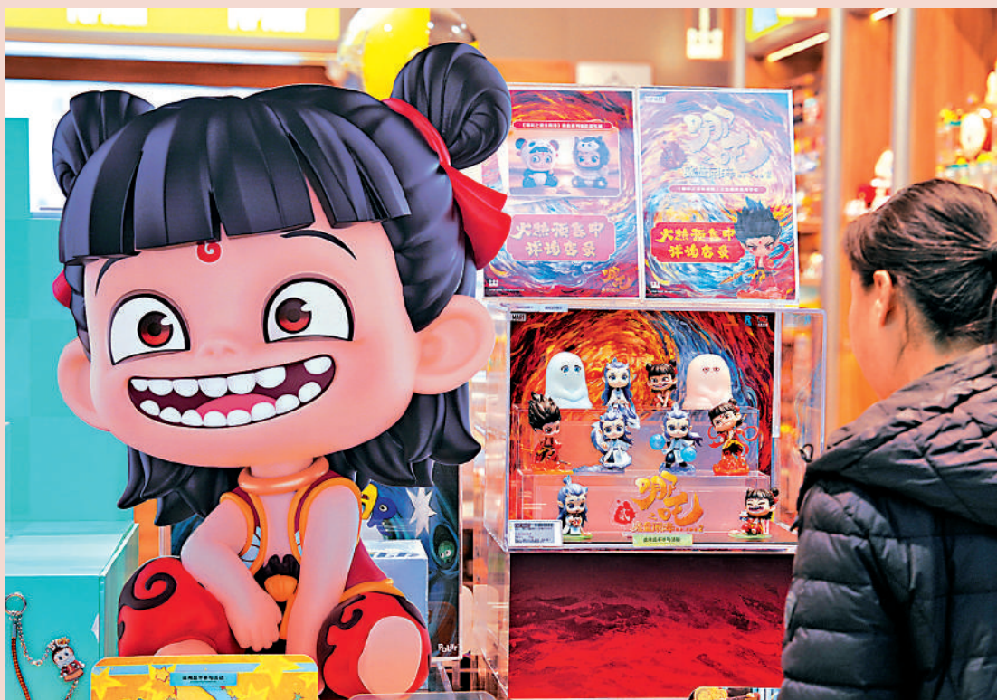
▲2025年政府工作報告提出，今年將實施提振消費專項行動。圖為北京一商舖內的電影《哪吒2》系列周邊商品吸引消費者。