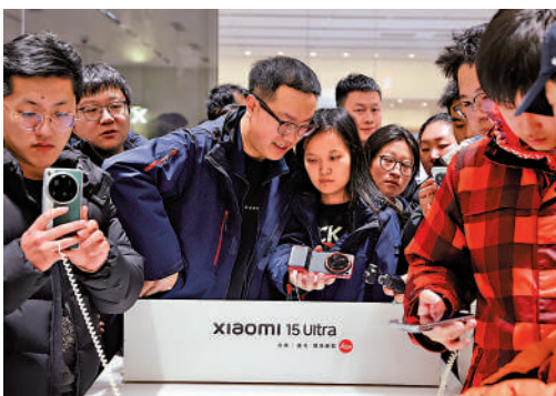
▲推動消費提質升級是擴大內需的重要內容。圖為消費者在北京小米之家體驗新款小米15 Ultra。