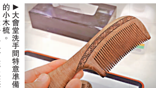
▲大會堂洗手間特意準備的小木梳。

一年一度的全國兩會，既是釋放重要政策訊息的信源地，同時也是透視國家政治風貌的百葉窗。今年兩會上，大公報記者驚喜地發現，一向嚴肅莊重的人民大會堂，竟然也變成了「細節控」，通過一處