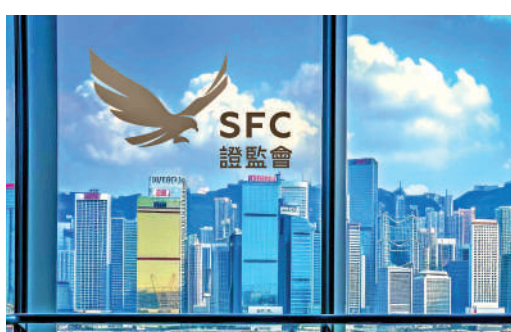
▲受惠港股成交額大幅增長，證監會季度盈餘按年大增2.4倍。

【大公報訊】證監會昨公布2024年10月至12季度報告，香港資本市場在全球投資者中備受青睞，多項數據表現亮眼。受惠港股成交額大幅增長，證監會季度盈餘按年大增2.4倍至7711萬元。此外，香港註冊成立的基金管理資產總值超過1.6萬億元，上市ETF平均每日成交額按年急升逾三成，港股通淨資金流入更創下十年新高。