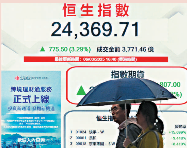
▲恒指昨日大升775點或3.3%，收復24000點心理關口。 中通社