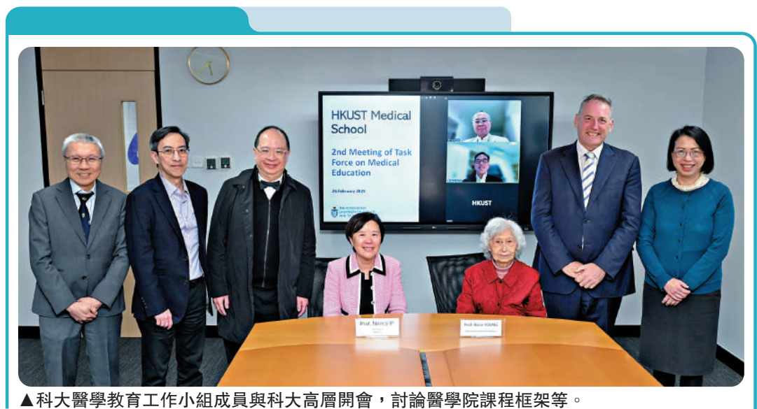
▲科大醫學教育工作小組成員與科大高層開會，討論醫學院課程框架等。

首次聚集香港出席實體會議，顧問小組會議由科大代表介紹計劃的主要策略範疇，包括醫學院的定位、課程設計、教學醫院的合作、本地和國際教職員招聘及可持續資金模式等。