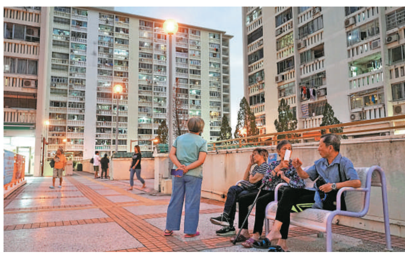
▲公屋入息及資產限額將於四月起上調。

房屋局昨日向立法會提交文件，交代2025/26年度公屋入息及資產限額檢討結果。文件顯示，各類家庭的公屋入息限額上調0.2%至2.5%，扣除強積金供款後實際增加50元至1230元不等，當中二人家庭最多，由19730元升至20230元，升幅達2.5%；四人家庭升幅最小，僅0.2%，由30950元加50元，至31000元。