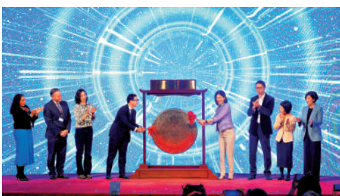
▲港交所於國際婦女節前夕舉行「為性別平等敲鐘」活動。

香港金融業性別多元化比例最高，比消費品行業高出一倍，尤其在財富管理和私人銀行領域。