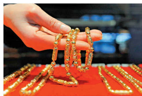
▲中國連續四個月擴大黃金儲備規模。

此外，中國再度增持黃金儲備，較1月末增長16萬盎司，中國2月末黃金儲備規模達到7361萬盎司。這已是中國連續四個月擴大黃金儲備規模。