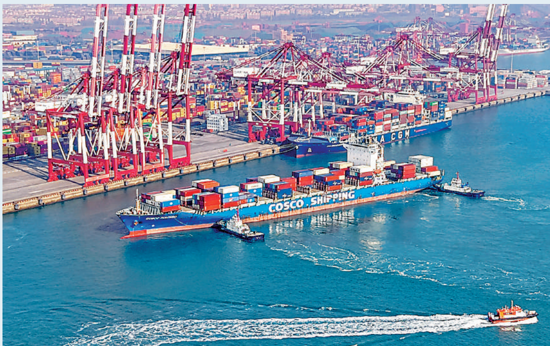
▲儘管面臨外部環境的不利影響，中國外貿表現穩健，仍展現出強韌性。