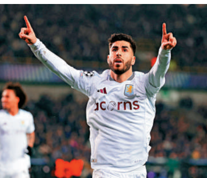
▲維拉翼鋒馬高阿辛斯奧。