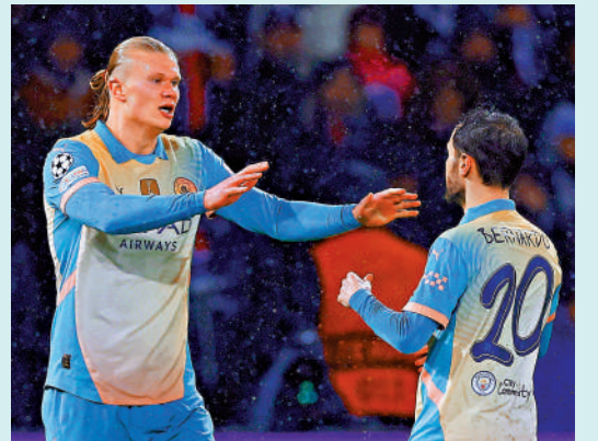
▲曼城前鋒夏蘭特(左)。