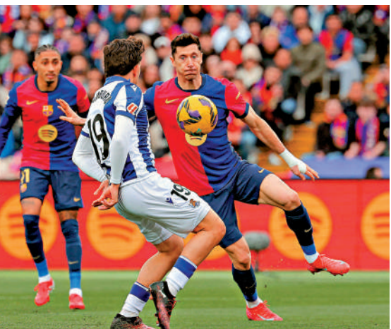
▲巴塞隆拿前鋒羅拔利雲度夫斯基(右)。

中華人民共和國 廣東省廣州市越秀區人民法院 民事判決書 (2024)粵0104民初26331號