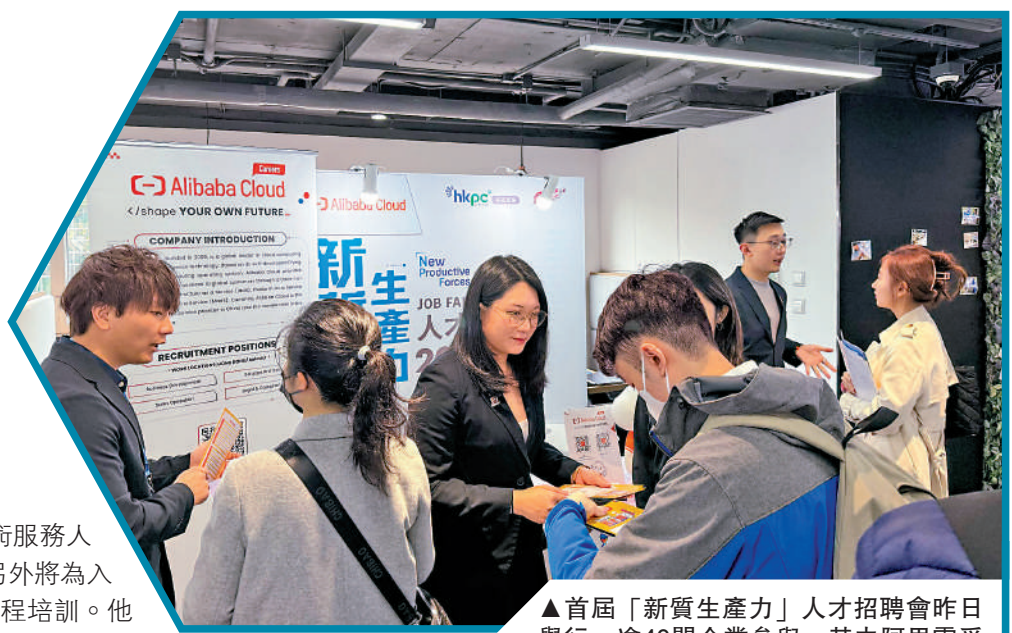
▲首屆「新質生產力」人才招聘會昨日舉行，逾40間企業參與，其中阿里雲受求職者關注。