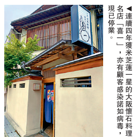
▲連續四年獲米芝蓮一星的大阪懷石料理名店「喜一」，亦有顧客感染諾如病毒，現已停業。

要預防感染諾如病毒，應避免進食生的海產，小心選擇冷盤，進食前及如廁後要洗手。徐樂堅說，酒精未能有效殺死諾如病毒，酒精搓手液並不能代替使用視液和清水潔手。