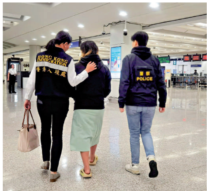
▲最後一名獲救港人，昨早在專責小組陪同下返港。

已脫險，要時間消化才敢相信已獲救，亦有人回憶過去幾個月被虐待日子，激動落淚，其中1名獲救女子更須由在旁的專責小組人員搭着肩膀不斷安慰。有獲救港人家屬表示，自去年年底與家人失聯後，度日如年，現在終於盼到親人回港，心情非常激動，感謝中央和特區政府的救援。