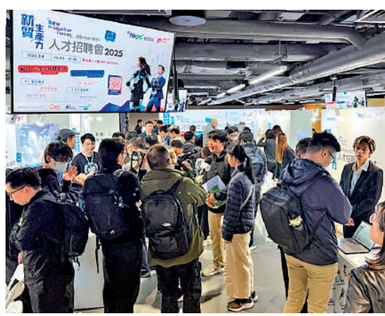
▲招聘會吸引大批求職者到場，現場氣氛熱烈。