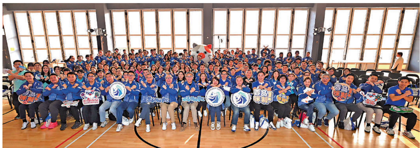
▲第四屆禁毒領袖學院啟典禮昨日舉行，培訓新一屆青少年禁毒領袖。

禁毒領袖學院於2021年由警務處毒品調查科成立，每年招募80名中學生及20名大學生成為學員，透過毒品知識工作坊、領袖才能訓練營、參觀、內地及海外交流等活動，培育他們成為青年禁毒領袖，在社區宣揚禁毒信息。首三屆學院共培育300名禁毒領袖，向超過11萬人傳遞禁毒信息。