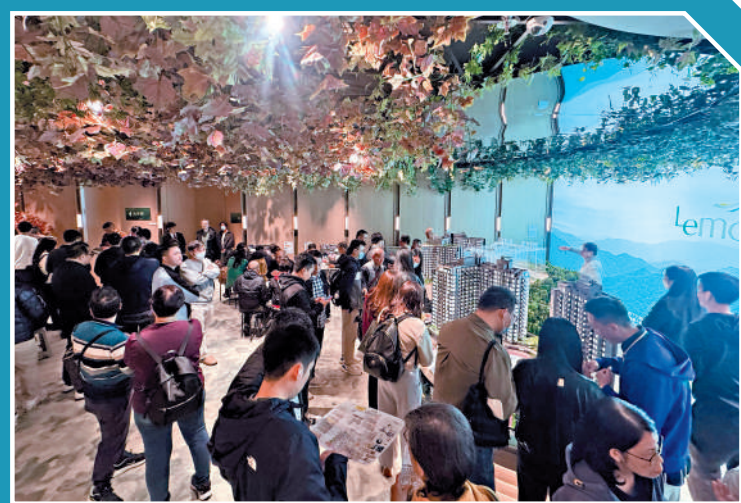
▲上然昨日參觀及收票情況熱烈,展覽廳擠滿睇樓客。