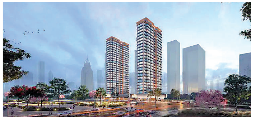
▲綠城·馥香園首推5號樓和6號樓，涵蓋南向四房戶，適合改善型家庭。

實用見使 位於廣州海珠西的綠城·馥香園，是海珠罕見的超級大盤。項目佔地4.2萬平米，建築面積7.1萬平米，計劃建造5幢住宅樓，整體單位規劃使用率高達125%。記者了解到，該項目樓高32層，提供648伙，居住舒適度相比超高層更為突出。項目綠化率35%，不僅自建一個街角公園，還沿河開發了河道公園，南向樓幢能享有一線河景，適合業主日常遛狗、散步。