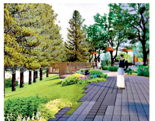
▲綠城·馥香園綠化率35%，自建街角公園之外，還沿河開發河道公園。

至於商業配套，項目周邊雖然沒有大型商場，但附近有不少街舖，餐飲選擇豐富，滿足日常就餐需求。如果需要購物，前往客村的大型商場也很方便。