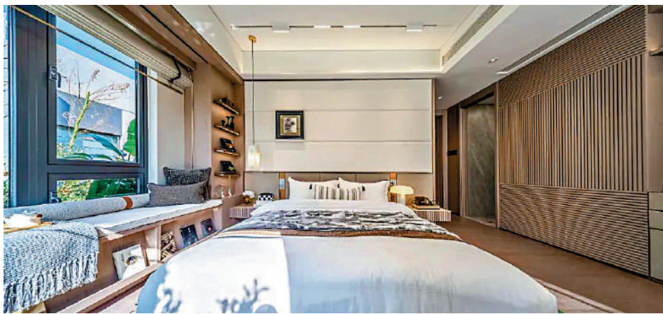
▲越秀·熙悅江灣主推三種戶型，間隔由兩房兩廳至三房兩廳，各具特色。

新晉屋苑 廣州海珠區廣紙新城配套日趨成熟，成為廣州熱門的置業板塊之一，越秀·熙悅江灣作為區域內的新晉熱門樓盤，亮相以來備受關注。2月中旬，該項目正式啟動認籌，當天吸引超過1200組客戶到訪，認籌量突破100組，市場熱度可見一斑。