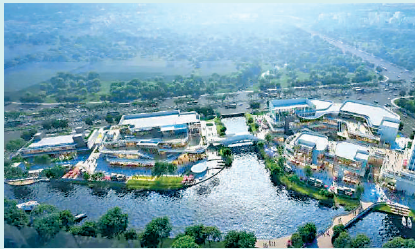
▲中海大境自帶約4萬平米濱水商業街區，以新加坡Vivo City為設計藍本。