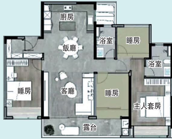
▲中海大境129平米四房兩廳戶型圖。

不過，記者走訪時發現，該項目雖然整體條件優質，但仍有些美中不足的地方。項目靠近中大布料市場和康鶯片區，城中村比較多，雖然已經啟動拆遷，但預計改造周期會比較長。