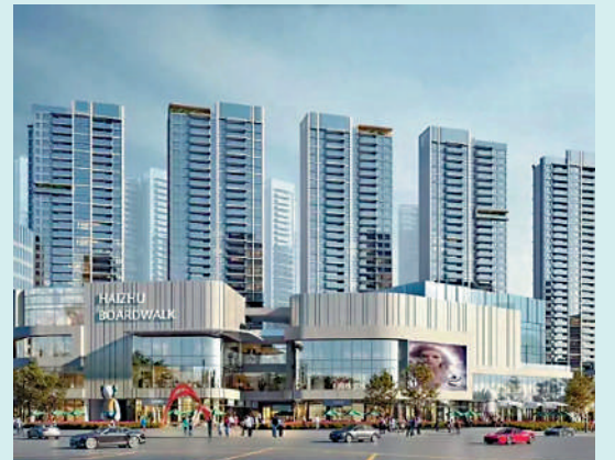
▲中海大境為總建築面積36萬平米的大型綜合項目，由15幢物業組成。