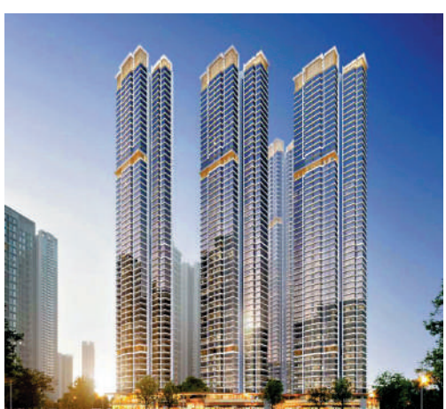
▲越秀·熙悅江灣由4幢57層高的樓宇組成，提供1040伙。

此外，項目周邊的生態資源也極具吸引力。居民僅需幾分鐘步行便可到達珠江邊，周邊還有廣紙歷史公園和規劃中的濱江公園，環境宜人，特別適合追求健康生活與自然氛圍的家庭。