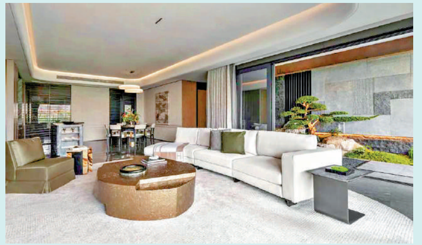
▲中海大境推出面積129和143平米兩種戶型，同為四房兩廳間隔。

中海大境位處廣州CBD中軸的南段，毗鄰廣州塔—琶洲商圈，文化地標「四大館」（廣州博物館、廣州藝術博物院、廣州科學館、廣州市文化館）環繞。值得一提的是，項目鄰近面積達1100公頃的海珠國家濕地公園，周邊環境優美，綠意盎然，空氣清新。記者了解到，該濕地公園最近吸引五星級酒店悅榕莊進駐。