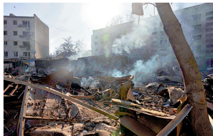
▲烏克蘭頓涅茨克地區7日遭俄羅斯空襲。

容。烏克蘭外交部發言人表示，烏方仍準備與美國達成礦產資源協議，並不排除在沙特簽署該文件的可能性。