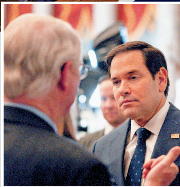
▲美國國務卿魯比奧。法新社