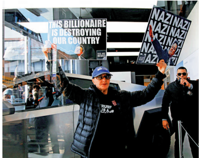
▲抗議人士在紐約一家特斯拉店舖外舉行反馬斯克示威。

此外，馬斯克旗下公司與17個聯邦機構簽訂了上百份合同。國會議員以及專門研究政府合同和倫理規範的律師質疑，馬斯克及其旗下公司涉及利益衝突。他們表示，在美國歷史上，從未有過馬斯克這樣一位面臨如此多監管問題以及數百億美元聯邦合同的公司高管，對政府運營擁有如此大的權力。（綜合報道）