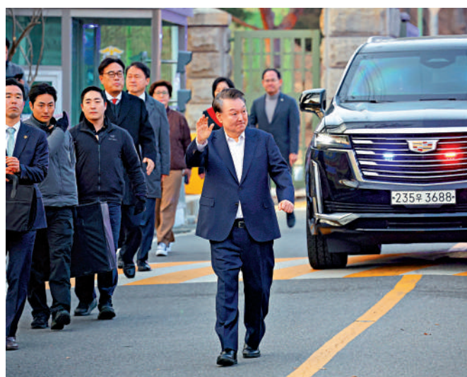
▲尹錫悅獲釋後在首爾拘留所外向支持者揮手。

韓媒稱，尹錫悅將在非羈押狀態下繼續接受憲法法院彈劾案等案件的審理。韓國法律界分析認為，法院取消拘留尹錫悅主要是基於對高級公職人員犯罪調查處（公調處）調查權爭議和檢方逾期起訴爭議的判斷，對於憲法法院彈劾案的審判不會產生太大影響。外界預計，憲法法院將於本月中旬對總統彈劾案進行宣判。