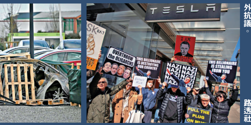
▲紐約民眾3月1日在特斯拉門店外抗議。

行業數據顯示，1月份整個歐洲的電動汽車銷量增長37.3%。但根據歐洲汽車製造商協會（ACEA）數據，當月特斯拉在歐盟、英國和歐洲自由貿易區的新車銷售量僅約9950輛，與去年同期相比暴跌45%。此外，美國總統特朗普去年11月初贏得大選後，特斯拉股價創下歷史新高。然而隨著馬斯克干預德國大選、支持英國極右翼政黨並攻擊英國首相斯塔默，特斯拉的市值已跌破1萬億美元。 萬英鎊損失。檢察官辦公室指出，證據顯示這場火警「絕非意外」，當局已經對「以危險手段破壞和損壞屬於他人的財產」展開調查。 據報道，西班牙、葡萄牙和英國也發生了此類抗議活動。一些特斯拉車主報告說，他們的汽車遭到破壞，汽車上被噴有納粹標誌，譴責馬斯克在1月特朗普的就職演說上兩次做出疑似納粹敬禮的手勢。