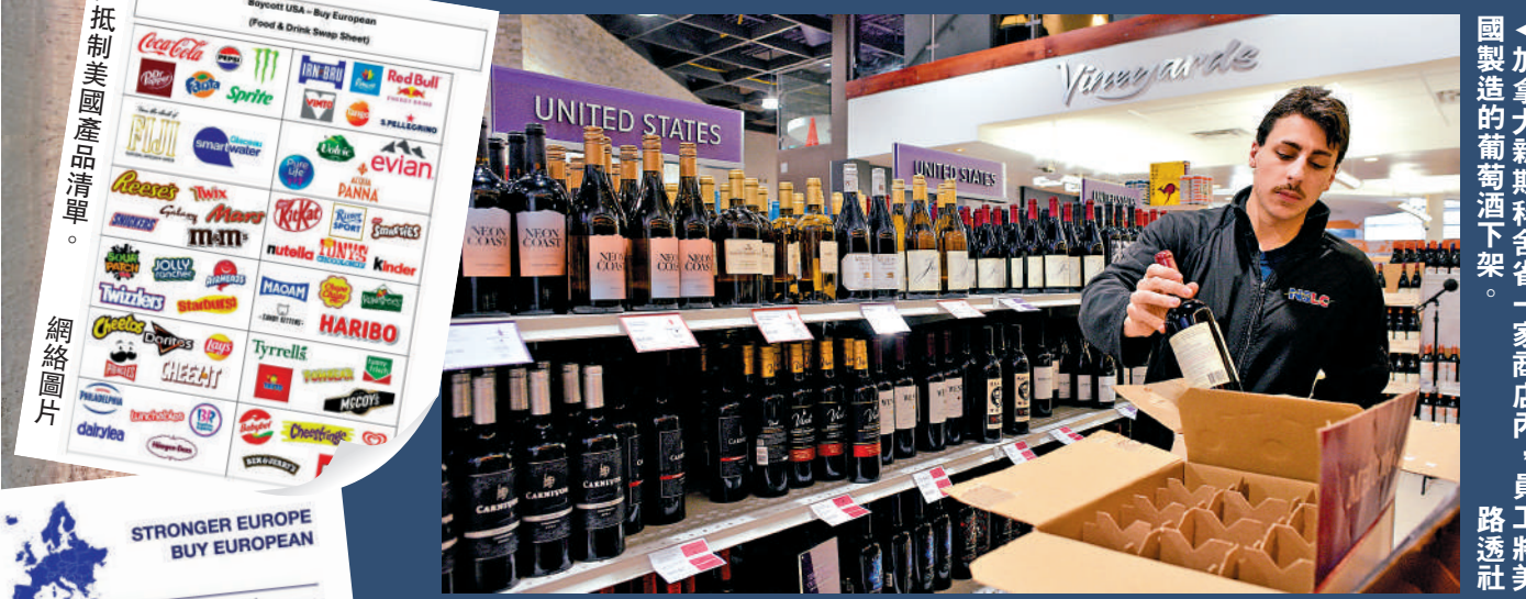
▲加拿大新斯科舍省一家商店內，員工將美國製造的葡萄酒下架。