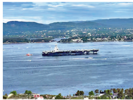
▲美國「福特」號航母駛往挪威奧斯陸峽灣。

何一升燃料」。 哈特巴克燃料公司專門為在挪威水域作業的船隻包括北約艦艇提供燃料服務，但不包括美國海軍艦艇。該公司在2024年向美國軍艦出售了約30萬升燃料。另外，挪威國防部長桑德威克2日特別發表聲明澄清，哈特巴克的決定「不符合政府政策」，「美軍將繼續從挪威獲得所需的補給和支持」。而格蘭則表示，「沒有人可以對我們指手畫腳。我們有權選擇我們的客戶。」