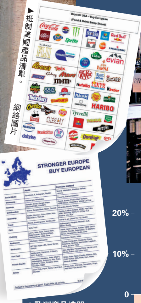
▲歐洲產品清單。