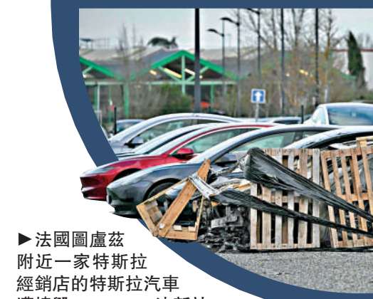
▶法國圖盧茲附近一家特斯拉經銷商的特斯拉汽車遭燒毀。

【大公報訊】據路透社報導：當地時間3月2日，法國南部一家特斯拉經銷商的12輛特斯拉汽車被縱火燒毀。外媒指出，這是因為特斯拉老闆馬斯克頻頻插手歐洲政治，公開支持歐洲極右派政黨、反對多元化價值觀，並與美國總統特朗普交好，引發歐洲國家民眾不滿。 據當地檢察官辦公室稱，當天凌晨3點15分左右，法國南部圖盧茲附近一家特斯拉經銷商的展廳發生火災，導致8輛特斯拉汽車被完全燒毀，另有4輛嚴重受損，造成至少55