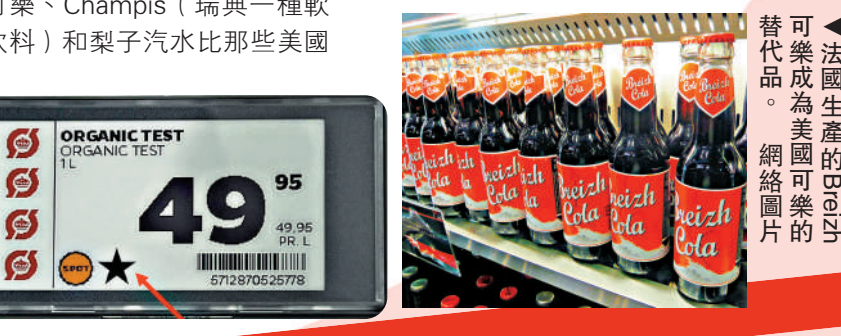
▲法國生產的巴黎可樂成為美國可樂的替代品。