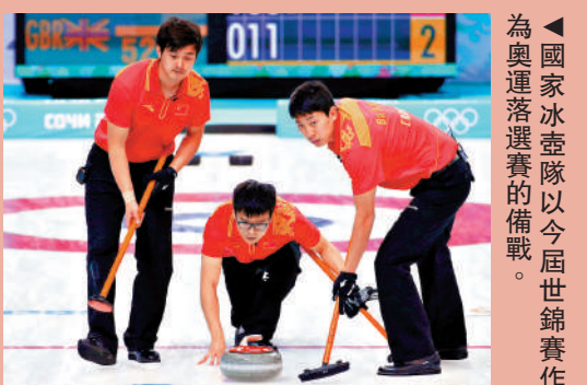
▲國家冰壺隊以今屆世錦賽作為奧運落選賽的備戰。

按照米蘭冬奧會冰壺項目參賽規則，除東道意大利自動獲得冬奧會直通資格外，2024年和2025年世錦賽除意大利隊外積分總和最高的7支球隊將獲得米蘭冬奧會參賽資格，另2個參賽資格由世錦賽未獲得奧運資格的隊伍通過落選賽產生。由於國家隊缺席2024年世錦賽，等於要用本屆世錦賽積分與參加過兩屆世錦賽的隊伍積分相比，直接通過世錦賽獲奧運門票機會微。國家隊今年世錦賽目標是加強鍛煉隊伍，為年底奧運落選賽打好基礎。