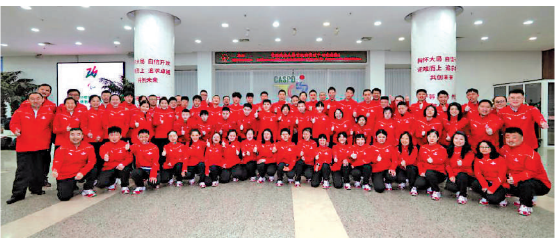
▲國家隊代表團合共78人出發意大利都靈參加第12屆世界冬季特殊奧林匹克運動會。

取勝利」的理念，致力於為智力障礙人士提供展示自我、融入社會的舞台。代表團表示，中國特奧運動員已準備就緒，蓄勢待發，他們將在都靈的賽場上傳遞溫暖與友情，彰顯生命價值，展現中國特奧運動的發展成果。