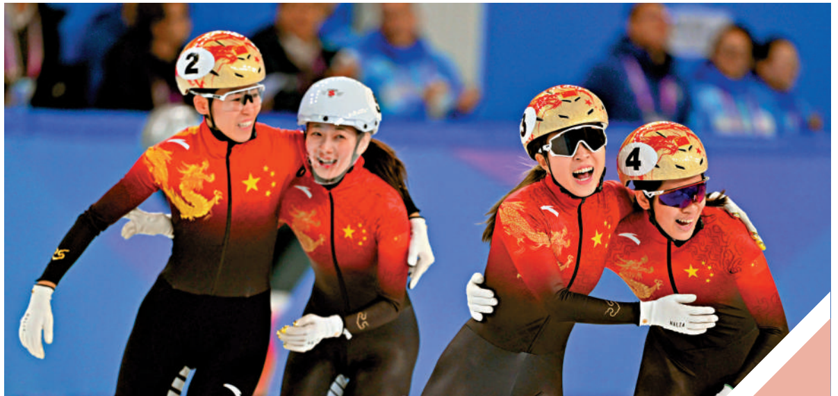
▲哈爾濱亞冬會短道速滑女子3000米接力A組決賽，國家隊奪得冠軍。

車橇項目包括雪車、鋼架雪車和雪橇三個大項。這些項目中，中國鋼架雪車隊的整體實力最強。殷正在上季八站世界盃比賽完成「三連冠」；而在女子鋼架雪車上，趙丹也曾在去年世界盃延慶站上斬獲銀牌，這是中國女子鋼架雪車隊歷史上的首枚世界盃獎牌。為了備戰米蘭冬奧會積分賽，中國三支車橇隊就在北京冬奧會場地「雪游龍」國家雪車雪橇中心展開訓練，並且建立後備人才營，擴充車橇項目的人才庫，為雪車雪橇項目的長遠發展奠定基礎。