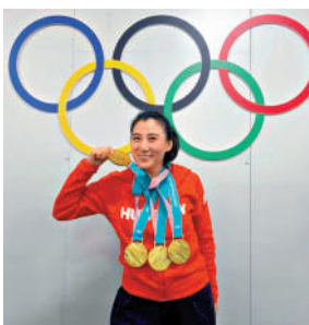
▲張晶是國家短道速滑隊新任主教練。