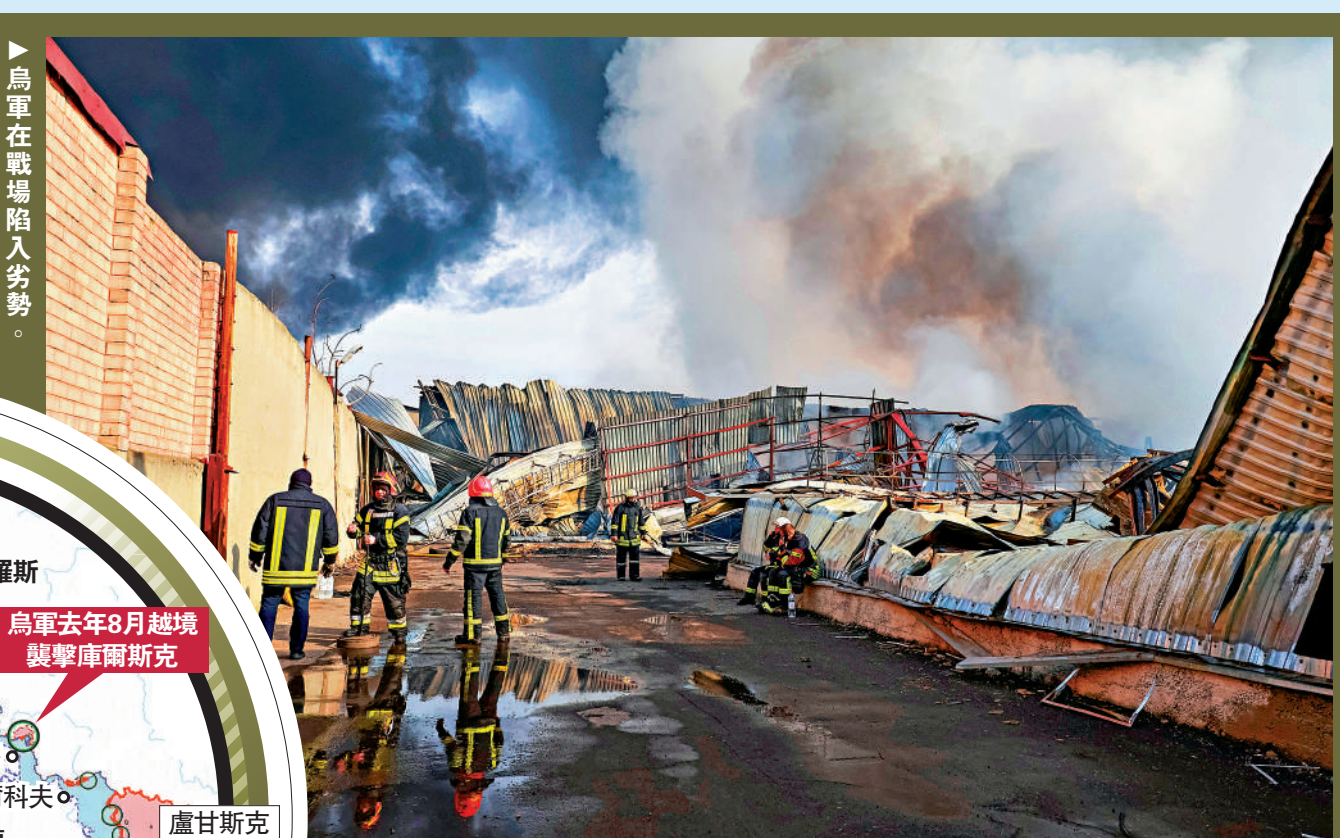
▲烏軍在戰場陷入劣勢。圖為敖德薩11日遭俄軍無人機襲擊。