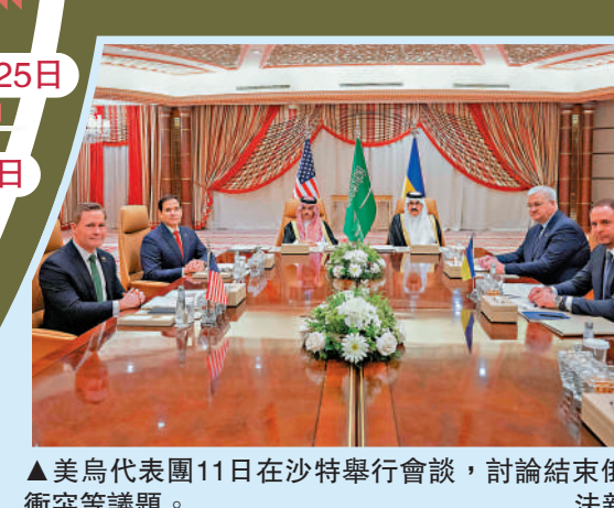
▲美烏代表團11日在沙特舉行會談，討論結束俄烏衝突等議題。