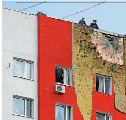
▲莫斯科科11日遭烏軍無人機襲擊，一棟住宅樓受損。

當地時間11日，美國和烏克蘭代表團在沙特阿拉伯城市吉達舉行會談，就俄烏局部停火等展開討論。美國國務卿魯比奧表示，此次會談是恢復美國對烏軍援的關鍵，並指出烏方需要做出比停火更大的讓步，包括割讓領土。他補充說，美方將在未來與俄羅斯的談判中確定俄方願意做出什麼讓步。美烏會談前夕，烏軍對俄境內發動今年最大規模的無人機襲擊。俄方稱，烏軍意在向美國證明其仍有戰鬥力。