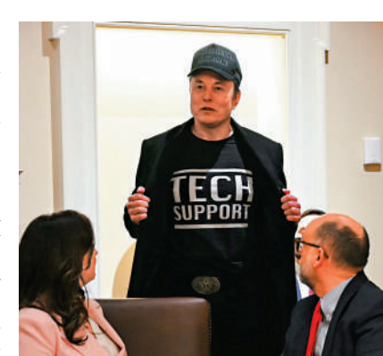
▲馬斯克將X平台服務中斷歸咎於來自烏克蘭的網絡攻擊。

俄烏衝突爆發後，馬斯克起初支持烏克蘭反擊，但隨著戰爭持續改變態度，呼籲美國停止對烏軍援以盡快結束戰爭。馬斯克旗下美國太空探索技術公司 (SpaceX) 為烏克蘭提供「星鏈」衛星網絡服務。馬斯克日前稱，如果他關閉「星鏈」，烏克蘭的整個前線都會崩潰。波蘭外長西科爾斯基回應說，波蘭為烏克蘭支付「星鏈」費用，若SpaceX不可靠，波蘭將尋找其他供應商。美國國務卿魯比奧指責西科爾斯基「忘恩負義」。