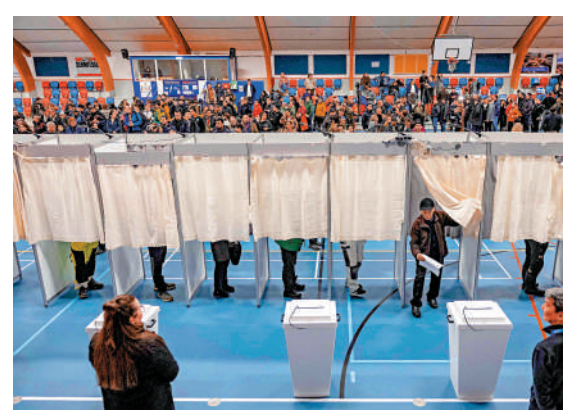
▲格陵蘭島居民11日參加議會選舉投票。

與歐洲建立更加牢固的聯繫，以確保我們的安全」。格陵蘭自治政府總理埃格德日前亦批評美國不尊重格陵蘭島，並表示特朗普「極其不可預測」，讓人們感到不安。埃格德說，若自己所在的因紐特人共同體勝選，他的首要任務是向美國明確表示，格陵蘭島屬於格陵蘭人。