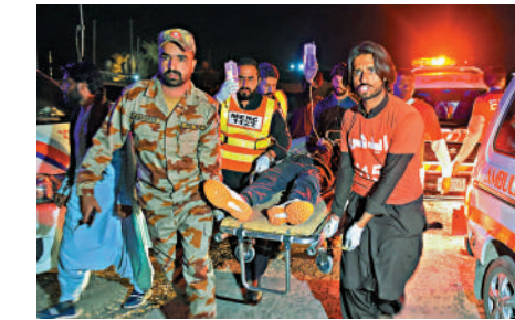
▲巴基斯坦安全部隊成員和志願者12日救援遇襲列車上的傷者。

部開伯爾—普什圖省首府白沙瓦的「加爾特快列車」11日在俾路支省錫比附近遭全副武裝的恐怖分子襲擊，恐怖分子炸毀鐵軌後控制火車，並將乘客扣為人質。巴安全部隊與恐怖分子進行長時間交戰，最終打死全部33名恐怖分子。恐怖分子在軍方實施清剿行動前殺害了21名人質，有4名軍人在清剿行動中死亡。