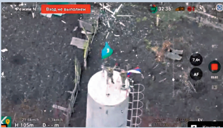
▲身穿軍裝的男子12日在蘇賈市中心揮舞俄羅斯國旗。

俄羅斯總統普京12日身穿軍裝視察邊境的庫爾斯克州，俄方表示，已奪回庫爾斯克州逾86%的烏軍佔領地區，收復三座重鎮。美方代表13日抵達莫斯科，與俄政府就俄烏衝突進行磋商。普京在13日表示，俄羅斯原則上同意美國的停火提議，但需要制定條件，強調應該為持久和平鋪路。消息人士稱，俄方已向美方提出永久結束戰爭的條件，包括烏克蘭不得加入北約、承認俄方對克里米亞和烏東四州的主權等。