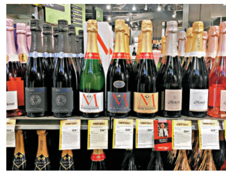
▲出口至美國的歐盟酒類產品面臨關稅威脅。資料圖片

Truth Social發文稱，若歐盟不立即取消對美國威士忌的50%關稅，美國將很快對來自法國和其他歐盟國家的所有葡萄酒、香檳和酒精飲品徵收200%的關稅。他還聲稱，歐盟是世界上「最具敵意和濫用關稅的機構之一」。聖一馬丁表示，特朗普正在升級他一手發動的貿易戰，法國將作出反擊，保護本國產業。