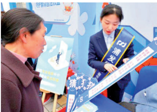
▲重慶13日舉行消費者權益保護活動，提醒民眾小心AI擬聲換臉騙局。