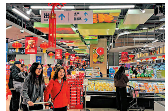
▲廣東省消費者委員會14日發布消費投訴分析報告。圖為廣州一家超市。