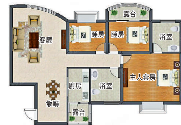
▲寶珠花園101平米三房兩廳戶型圖。