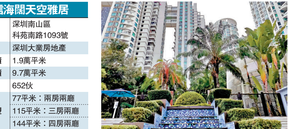
▲中信海闊天空雅居着重綠化，環境優美。

高端住宅 對於追求高端居住體驗的買家來 說，紅樹別院是一個值得期待的選項， 樓盤原名為英倫名苑四期，緊鄰科技園 華潤城中心，對外交通便利，距離地鐵1號線高新園 站僅數百米。小區周邊商業氛圍濃厚，與華潤萬象 天地為鄰，大型購物中心環繞，滿足住戶多元化的 消費需求。