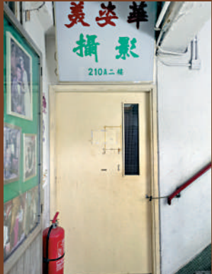
▲「美姿華攝影室」雖不再營業，但依然保留招牌。

至於影樓不再經營之後，未來何去何從？陳伯女兒表示，先保持現有的狀態。現時，店內珍藏有不少過去的老照片，家人也考慮過將父親拍攝的老照片數碼化，甚至也有顧客建議何不舉行一個展覽？對於是否辦展，她未置可否，只說道：「以前的老顧客告知我們，如若之後舉辦一個展覽，一定要告知他們前來參觀。」