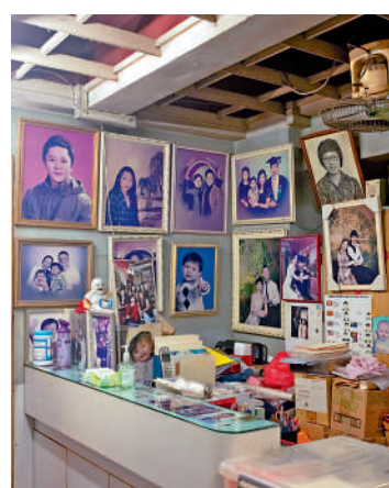
▲「美姿華攝影室」影樓內部，可見懸掛的人像照片。