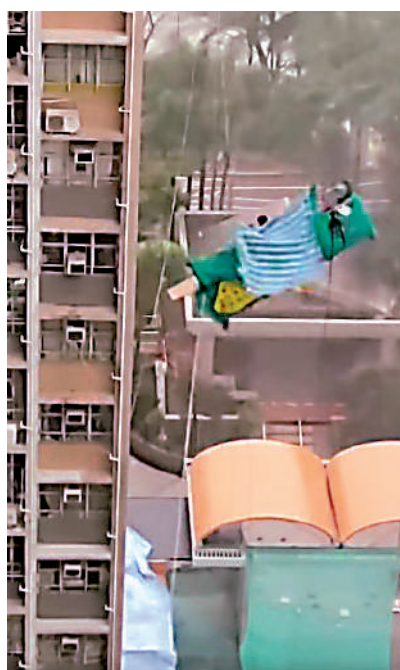
▲天水圍天瑞邨瑞心樓外牆三架吊船，昨午被強風吹至不斷搖晃。

其間，天水圍天瑞邨瑞心樓外牆三架吊船，昨午被強風吹至不斷搖晃，其中兩架上各有一名及兩名男工人被困，三人大聲呼救。有網民在社交平台分享影片，拍攝到吊船被吹離外牆，甚為驚險，吊船的吊索有部分脫離位置，雜物於強風下狂飛，吊船上一名男工人緊捉吊索保命。途人見狀報警，消防員到場將他們救回安全位置，無人受傷。