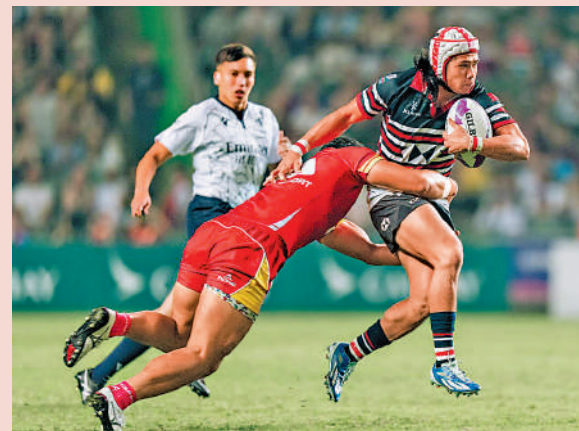
▲截至本月十三日，七欖賽事已售出逾三萬八千張三日套票，總門票數量達到十一萬五千張。

「香港國際七人欖球賽」將於本月28日至30日舉行，中國香港欖球總會上周公布，截至本月13日，七欖賽事已售出近3.85萬張三日套票，累計一連三日的總門票數量達到11.55萬張，售出的門票數量已超過以往數字；企業包廂在數月前已全部售罄，臨時企業包廂的銷售率已達至99%。據總預計，七欖門票銷售將進一步增加，今屆賽事將創下單日門票銷量的歷史新高。