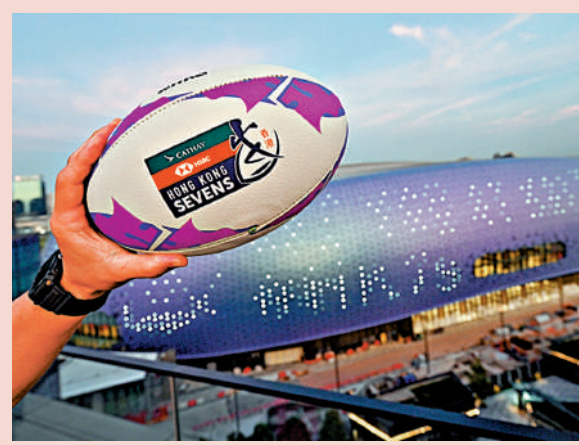
▲「香港國際七人欖球賽」將於本月底首度移師啟德體育園，在可容納5萬名觀眾的主場館舉行。