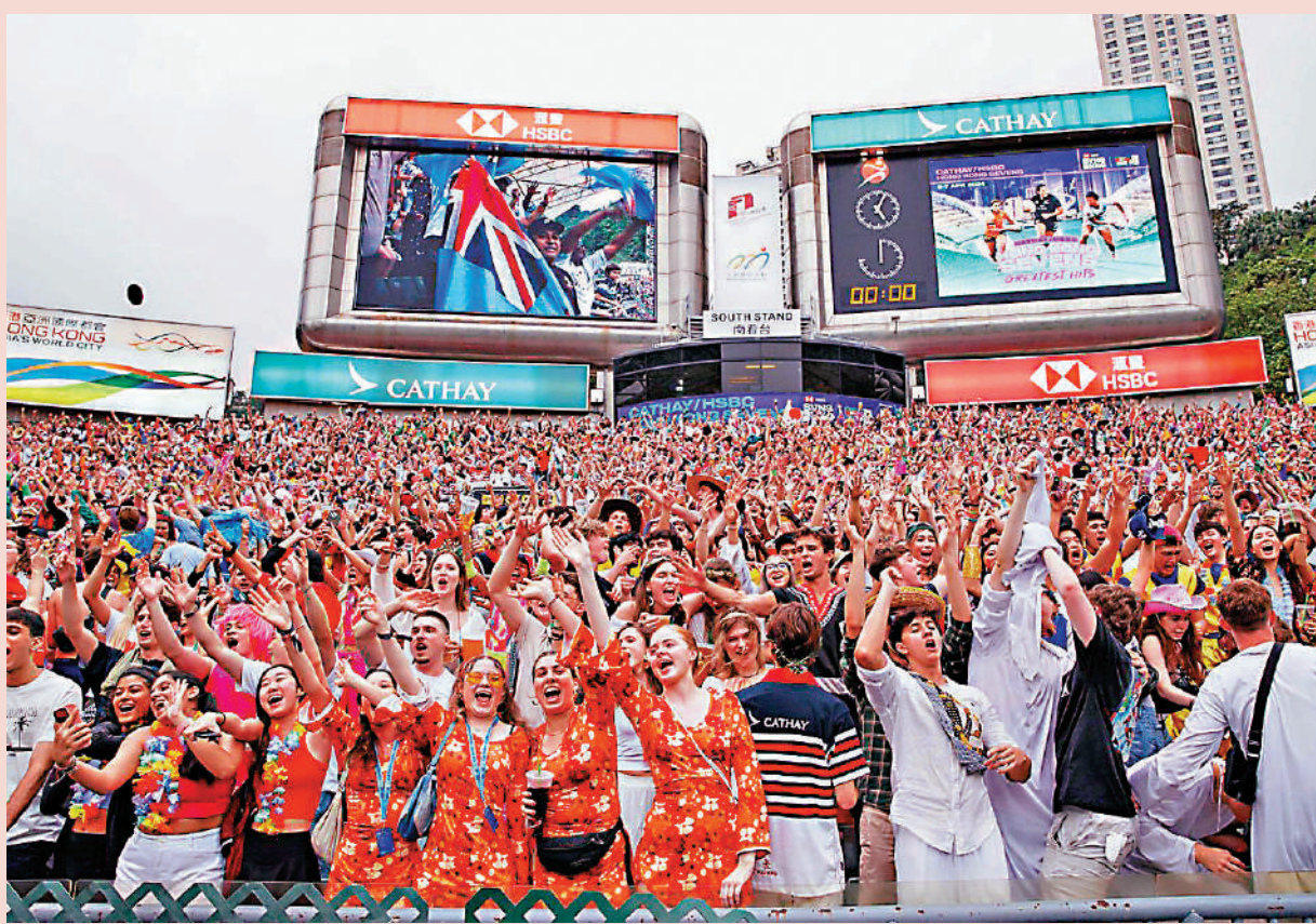
▲過去每屆七欖賽事派對氣氛濃厚，入場觀眾不乏高消費旅客。