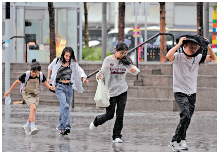
▲本港昨日下午強雷雨襲港，狂風大作。

【大公報訊】本港昨日天氣突然變壞，天文台昨日下午3時發出黃色暴雨警告信號，到3時20分左右在大埔接獲冰雹報告，至下午4時35分取消黃色暴雨警告信號，其間強雷雨襲港，狂風大作。