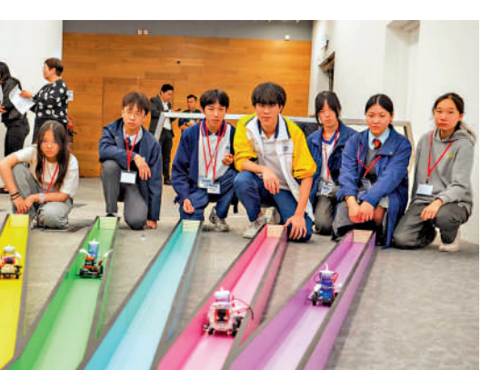
▲首屆「氫能車競賽大挑戰2025」於昨日舉行，共21隊師生晉級，戰情緊張。

客空間活動，學生們利用大會提供的材料設計並組裝了氫能四驅車，親身體驗從理論到實踐的創新過程。