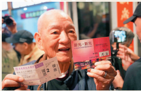
▲伯伯左手持廿年前新光大戲票，右手則是臨關閉前的戲票。

新光戲院結業前最後一日，大批戲迷除了把握最後機會睇戲，還有不少市民專程來拍攝記錄戲院內的多個獨特打卡位，包括最引人注目的「新光」霓虹燈招牌、復古咕式磅重機，以及大堂天花板懸掛的波波燈等。