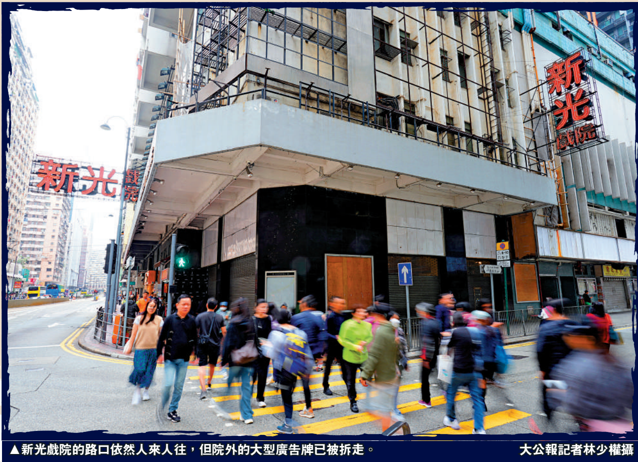
▲新光戲院的路口依然人來人往，但院外的大型廣告牌已被拆走。