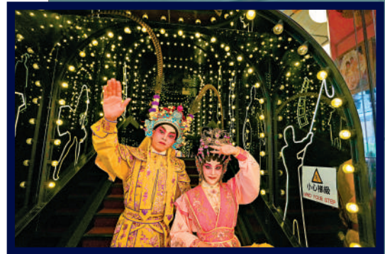
▲粵劇演員也站在新光的特色通道拍照留念。