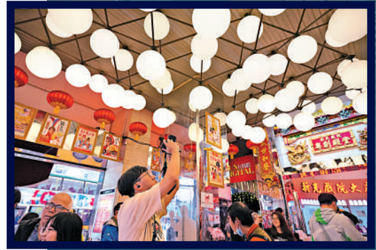
▲戲院大堂一排排的波波燈令人非常懷念。