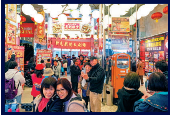
▲各方而來的市民送別「香港粵劇殿堂」新光戲院。