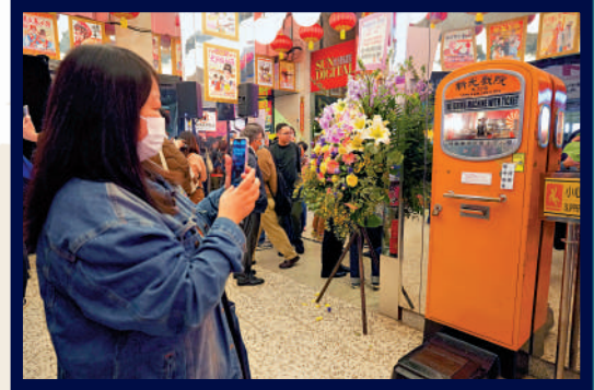
▲新光大堂的古老磅重機的去向惹人關注。