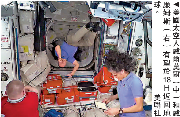
▲美國太空人威爾莫爾（中）和威廉姆斯（右）有望於18日返回地球。

過去幾個月，美國總統特朗普及其親信、SpaceX行政總裁馬斯克多次指責前總統拜登出於政治原因不願讓SpaceX接回兩名太空人，導致他們被困太空。