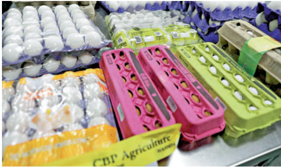
▲聖迭戈執法人員截獲違法進入美國的雞蛋。

●美國總統特朗普上任後組建的「政府效率部」（DOGE）在多個聯邦政府機構推進裁員計劃，農業部多名負責應對禽流感的員工今年2月也被解僱。幾天後，農業部又嘗試召回這些員工。此外，特朗普政府一度暫停聯邦衛生機構對外通訊，導致美國疾控中心（CDC）關於禽流感的報告無法及時發布。