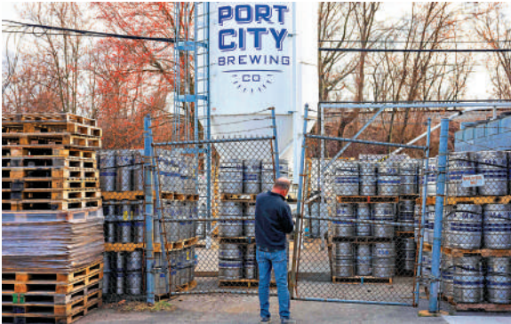
▲特朗普加徵關稅，美國經濟遭反噬。圖為需要支付更高成本進口原材料的美企。

【大公報訊】據彭博社報道：美國總統特朗普16日重申，他將按計劃於4月2日開始對貿易夥伴徵收對等關稅，還將對關鍵行業徵收額外關稅。他補充說，不打算豁免任何國家的鋼鋁關稅。特朗普此前在對加拿大和墨西哥加徵關稅的問題上反覆無常，導致投資者信心下滑，紐約股市三大股指近期