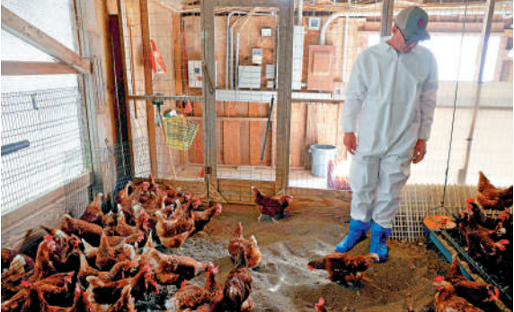
▲美國養雞場面臨禽流感威脅，雞蛋供應減少。

今年2月，賓夕法尼亞州發生了一宗震驚全美的「雞蛋大劫案」，一家雞蛋供應商配送拖車上的約10萬枚雞蛋失竊，總價值超過4萬美元。幾天後，西雅圖一家咖啡館也發生雞蛋失竊案，兩名男性疑犯偷走540枚雞蛋。