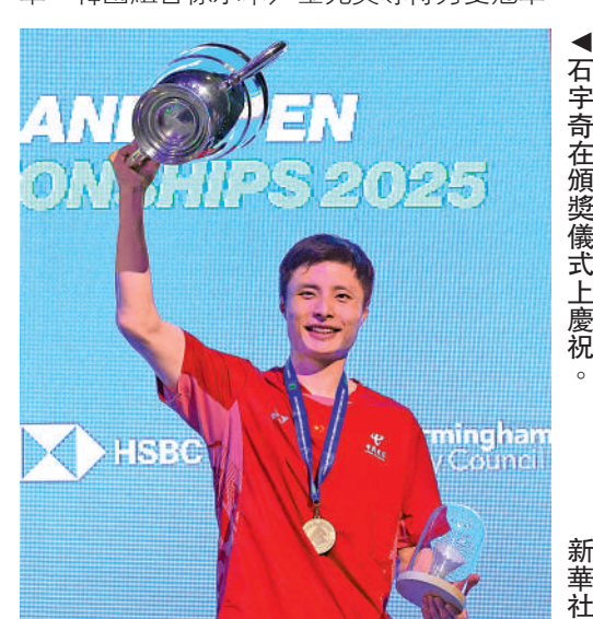
▲石宇奇在頒獎儀式上慶祝。