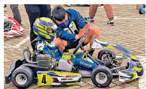
▲兒童組車手準備發車。大公報記者夏微攝

【大公報訊】記者夏微上海報道：剛過去的周末，2025 CKK中國卡丁車錦標賽R1上海站圓滿結束，來自10多個國家或地區的130名車手齊聚上海國際賽車場卡丁車世界展開激烈角逐，兒童組、青少年組、成人組、大師組……賽車的魅力席捲申城，無數追夢的身影在賽道上飛馳。