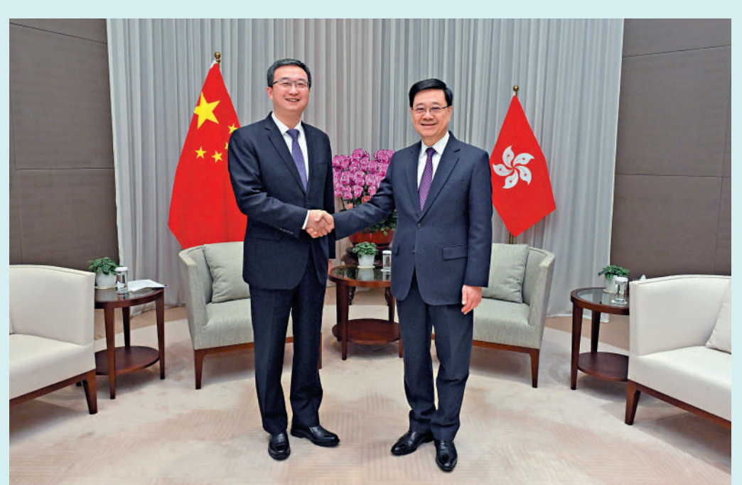
行政長官李家超（右）昨日與東莞市委書記韋皓（左）會面。

政府發言人表示，東盟與香港的關係源遠流長，亦是香港第二大貿易夥伴，特區政府非常重視與東盟國家的合作。計劃下，特選人士在香港的口岸可享自助通關服務，將大大提升通關效率和體驗。特區政府期望透過計劃主動為東盟的商界和其他範疇的領袖提供更多來港便利，以促進多方面交流，達至互惠共贏。