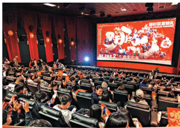
▲《哪吒2》北美首映現場火爆。

北美排片突破1000間影院 澳紐排片突破162間影院 刷新近20年華語電影排片與票房紀錄