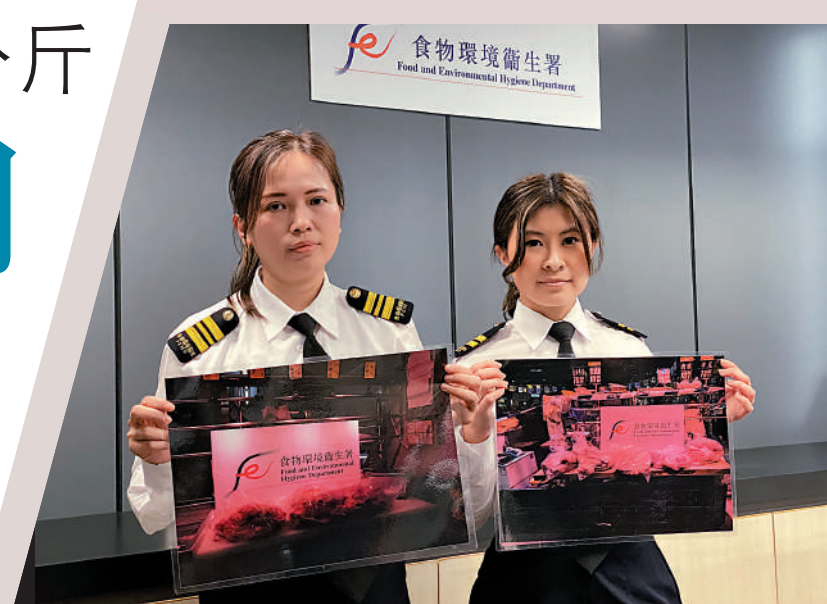
▲食環署打擊以冰鮮或冷藏肉充當新鮮肉出售的檔舖。