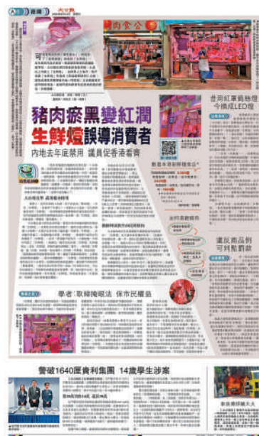
▲《大公報》去年八月直擊肉檔用「生鮮燈」令瘀黑豬肉看似紅潤。

香港食品創新科技中心總監方麗影博士提醒市民，新鮮肉類的正常顏色應為鮮明的棕紅色，而非過於鮮豔的紅色，表面應有自然光澤。按壓時，肉質應具彈性及少許黏性，色澤呈自然棕紅色，且不應有異常的腐壞氣味。市民購買時應多加留意，以免誤購冒充鮮肉的凍肉。