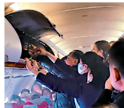
▲港航客機上空姐及乘客合力救火。