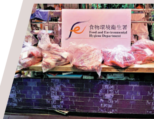
▲行動中檢獲的冷藏肉。