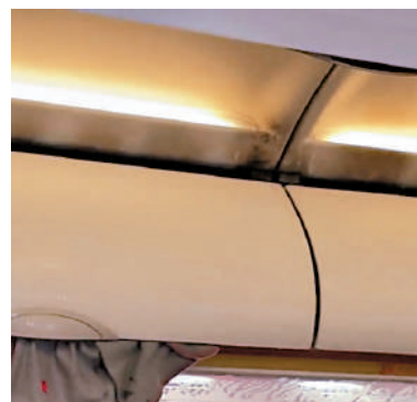
▲行李架有燒焦痕跡。

海關表示已聯絡部分投訴人，並向他們錄口供，了解他們的購買詳情，有受害人最早於去年6月訂購婚戒；涉案公司自稱婚戒設計公司，多次參與展覽，吸引不少準新人訂購婚戒，但該公司接單時以訂造需時為由，與客人訂立3個月交貨期，但到交貨時卻以送錯貨、需要修改或各種理由延遲交付，這種情況令各新人失去預算，可能要另覓婚戒，有人甚至在結婚當日仍未婚戒行禮，形容一件理應充滿喜悅的人生大事，成為新人不能忘記的遺憾。海關強調會嚴肅跟進案件，不排除有更多人被捕，並呼籲其他受害人向海關舉報。