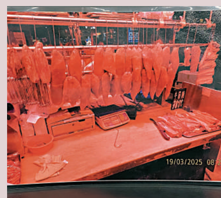
▲涉「魚目混珠」的肉檔。