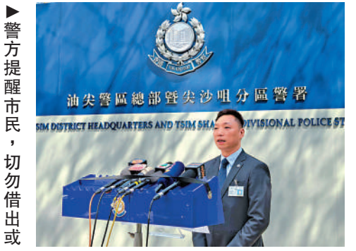
▲警方提醒市民，切勿借出或賣出戶口予不法之徒。