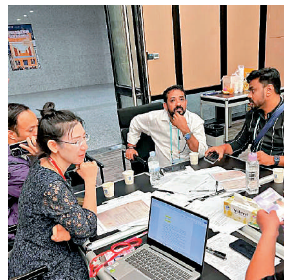
▲去年第136屆廣交會投訴站調解現場。

受訪香港律師表示，香港作為國際知名的法律服務中心，擁有豐富的法律資源和專業人才，而大灣區內地城市則擁有龐大的市場潛力和發展空間，雙方未來在國際仲裁、調解領域的合作具有廣闊的市場前景。