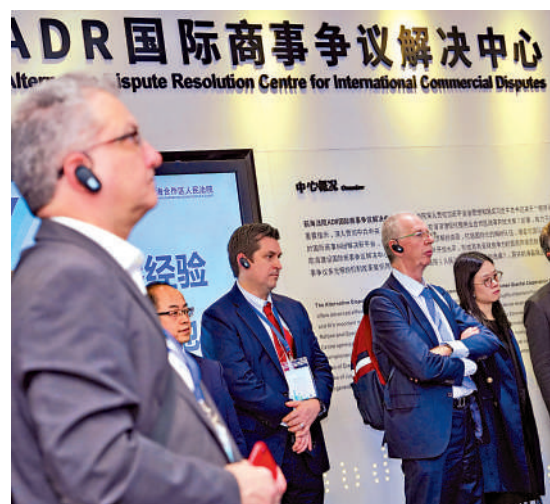
▲去年12月，香港涉外法律人才代表團參觀前海的ADR國際商事爭議解決中心。

未來，深港法治深度融合仍然任重道遠。兩地需要推動法律體系的深度適應和融合，完善跨境司法協助機制，增進法治認同和文化融合。同時，還需要積極探索新的合作模式和機制，為深港法治融合提供更加有力的支持和保障，為粵港澳大灣區的法治建設和經濟發展提供更加堅實的法治保障。