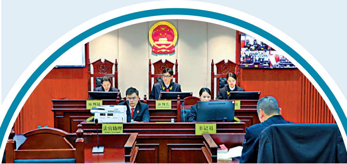
▲前海近年積極進行司法創新。圖為1月9日，廣州海事法院前海巡迴法庭啟用，審理一宗涉港人及外資企業的糾紛案。