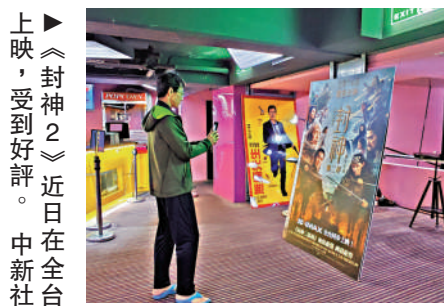
▲《封神2》近日在全台上映，受到好評。

資料顯示，《哪吒2》累計票房（含預售及海外票房）已超20億美元，超過《星球大戰：原力覺醒》，挺進全球影史票房榜第5。