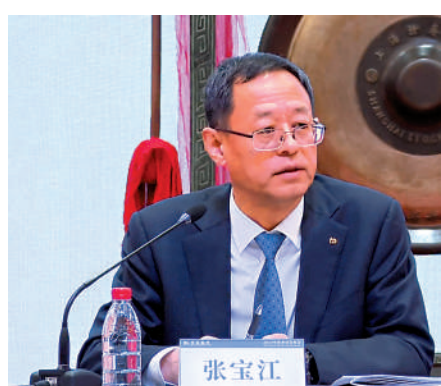
▲張寶江表示，去年交通銀行業務規模穩步提升。

【大公報訊】交通銀行（03328）昨日公布截至去年12月底止全年業績，淨利潤按年增長0.9%至935.86億元（人民幣，下同），利息淨收入增3.5%至1698.32億元，信用減值損失收窄至約525億元，不良貸款率微降0.02個百分點至1.31%，撥備覆蓋率升至201.94%。末期息每股0.197元，全年派息0.379元。該行行長張寶江表示，2024年交通銀行業務規模穩步提升，盈利能力保持韌性，資產質量持續夯實，全年A股及H股的股價漲幅超過40%。