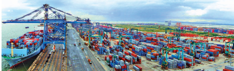
▲中遠海控去年碼頭業務完成總吞吐量1.44億標準箱。

【大公報訊】中遠海運系相繼公布去年業績。集運市場在全球貿易逐步復甦的帶動下，去年貨量呈現溫和增長態勢；同時，紅海局勢持續動盪，導致有效運力供給整體不足，運價處於相對高位，帶動中遠海控（01919）去年股東應佔淨利潤按年增長1.05倍至491億元（人民幣，下同），每股基本收益3.08元。中遠海控表示，未來複雜多變仍將是集裝箱航運業的主基調。