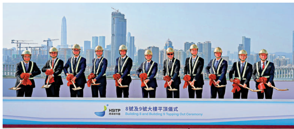
▲行政長官李家超昨日出席港深創科園8號及9號大樓平頂儀式。

李家超形容，河套香港園區是香港特區作為「超級聯繫人」和「超級增值人」的一個「超級發揮平台」。政府會利用好香港的高度國際化和集聚國際高端人才的優勢，把河套打造成為國家科技創新的橋頭堡、高端成果的示範田和孵化器。李家超又透露，政府今年很快會揀選合適的地塊，並徵求私