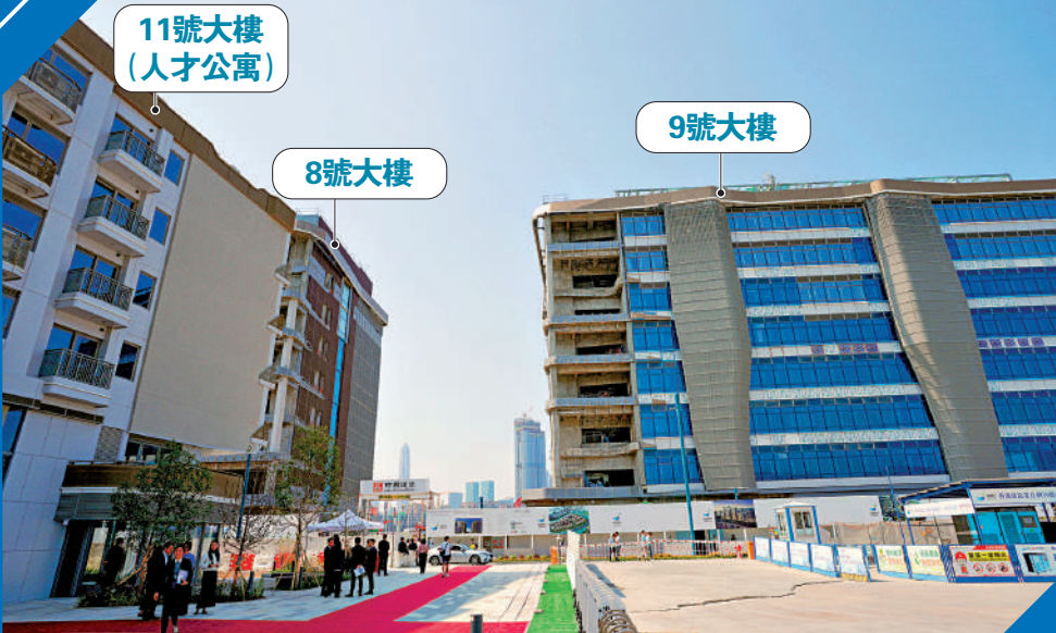
▲港深創科園第一期的三座大樓已經落成。