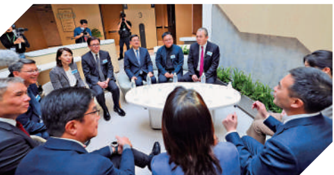
▲李家超與有意落戶園區的頂尖科技企業代表交談。

李家超昨日參觀為園區員工提供的單人及家庭示範單位，對其完善的生活配套設施表示讚賞。隨後，他與五家有意落戶園區的頂尖科技企業代表進行了深入交流，包括韶音環球、阿斯利康、華大集團、天齊鋰業以及歌爾微電子。這些企業對河套香港園區的發展前景充滿信心，並希望透過進駐園區，進一步發揮香港作為「超級增值人」的角色以及聯通大灣區的獨特優勢，推動技術研發和認證申請，提高市場佔有率。