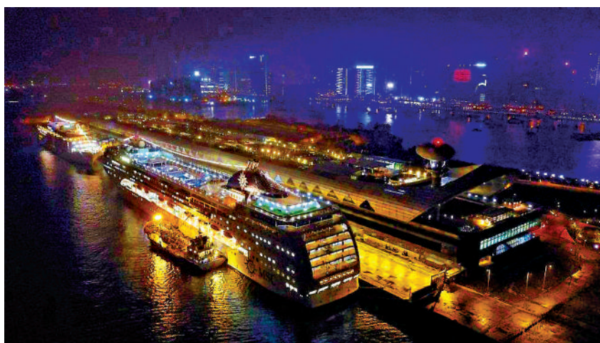
▲2025年度「世界50最佳酒吧」頒獎典禮將於10月8日在啟德郵輪碼頭舉辦。

二年，香港首次透過舉辦「世界50最佳酒吧」，雲集全球酒吧界頂尖精英。香港的酒吧面貌充分體現本地多元文化和創新，奠定香港成為全球品酒愛好者必遊之地。這場盛事於10月蒞臨香港，連同「香港美酒佳餚巡禮」登場，相信會將10月美食慶典帶向高潮。