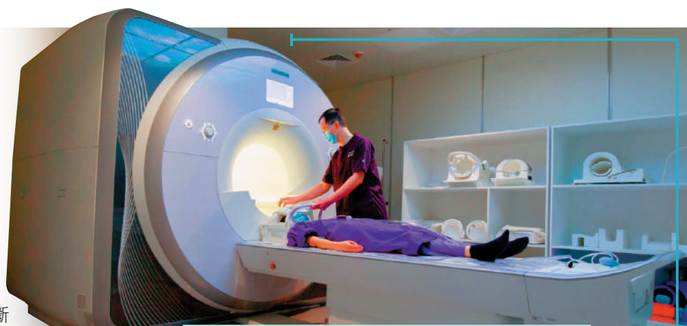
▲醫管局昨日表示，正探討放射診斷檢查採用逐項收費模式，病人須支付共付額接受服務。