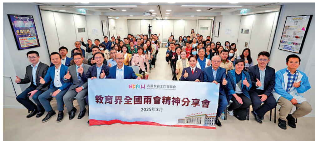
▲教聯會昨日舉辦首場「教育界全國兩會精神分享會」。

【大公報訊】實習記者胡龍逸報道：教聯會昨日舉辦首場「教育界全國兩會精神分享會」，港區全國人大代表兼教聯會主席黃錦良、港區全國人大代表陳帆、鄭美雲及沈漢迪出席分享。會上各代表踴躍發表意見，表示透過認真學習貫徹全國兩會精神，積極融入國家發展大局，為培養愛國愛港人才作出貢獻。