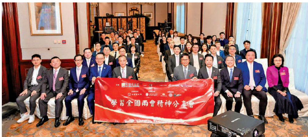
▲香港菁英會昨日舉辦「學習全國兩會精神分享會」。

【大公報訊】記者陸九如報道：香港菁英會昨日（21日）舉辦「學習全國兩會精神分享會」。多名港區全國人大代表及全國政協委員出席並分享心得體會，傳達和學習兩會精神，協助本港各界人士深入了解會議內容，加速融入國家發展大局，助力香港青年把握發展機遇。