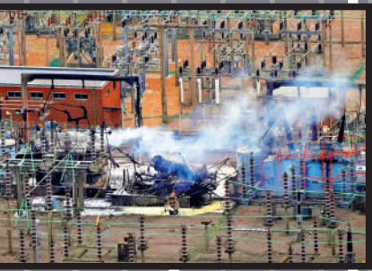
▲變電站大火被撲滅後，仍不斷冒出白煙。