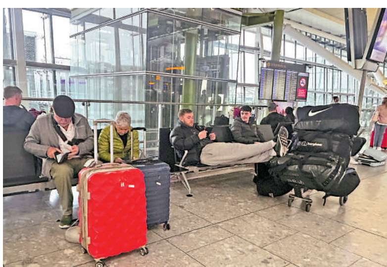
▲大批旅客22日在希思羅機場等待登機。

22日從香港出發去希思羅機場的航班基本恢復正常。國泰航空當天5班航班均如期出發，而英航原定晚上出發的BA32航班則取消。22日由希思羅機場回港