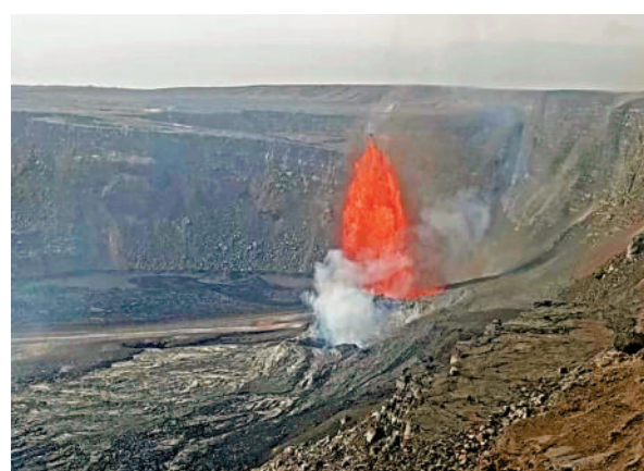
▲夏威夷基拉韋火山20日噴射「熔岩噴泉」。美聯社

【大公報訊】綜合《日本時報》、美聯社報道：日本政府21日就富士山大規模噴發引發火山灰沉積發布應對方案，根據不同嚴重程度擬定四階段應對方案。這是日本政府首次就「富士山大噴發」發布防災指引。富士山上次大規模噴發要追溯到1707年。