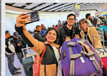
▲22日抵達希思羅機場的乘客開心自拍。

●英航表示，當地時間21日晚有8班長途航班從希思羅機場起飛，是機場重開後恢復的第一批航班，22日也盡量讓最多航班飛行；維珍航空、美國航空等航司稱22日航班大致正常。