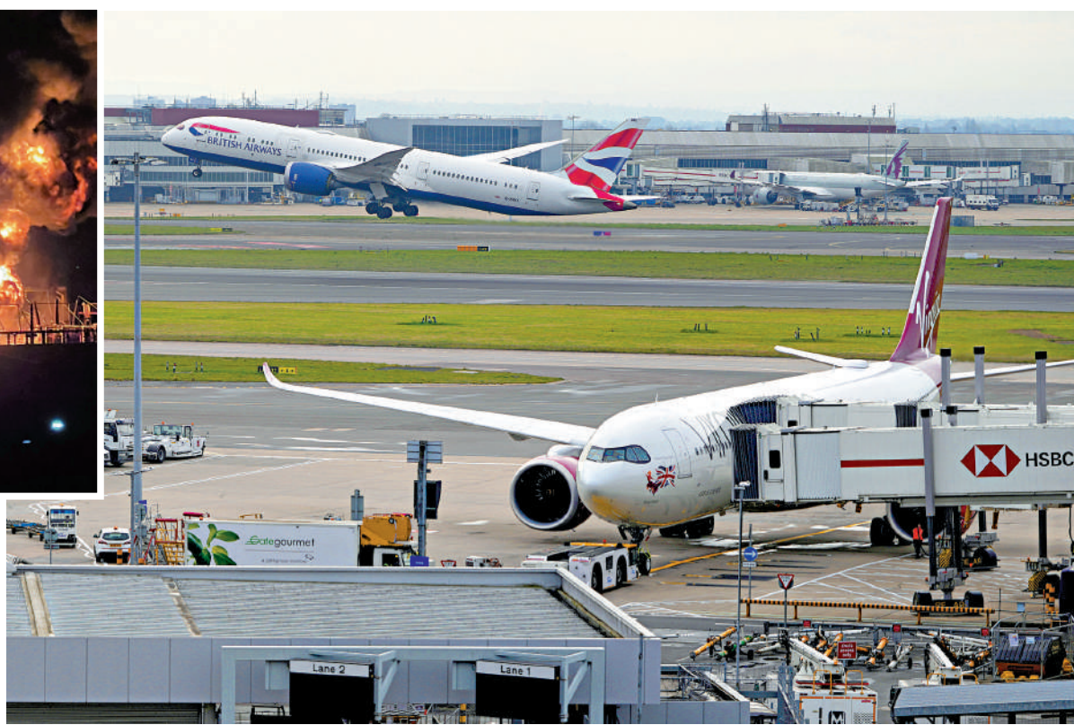
▲倫敦希思羅機場22日全面恢復運作。

因附近變電站起火，英國倫敦希思羅機場21日遭遇大停電。在關閉約18小時後，希思羅機場於當地時間21日下午開始恢復航班升降，22日全面恢復運作。專家表示，此次事故造成的損失每天高達2000萬英鎊（約2億港元），整個航空產業恐損失數千億英鎊。變電站起火的原因仍在調查中，外界批評希思羅機場過於依賴單一電網、缺乏應變措施，也引發了多間英媒對本國關鍵基礎設施漏洞百出的集體焦慮和質疑。