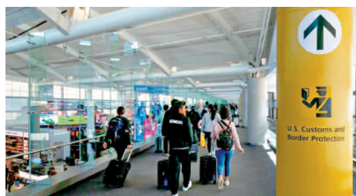
▲近日多名歐洲公民入境美國時被捕。

【大公報訊】綜合路透社、新華社報道：因美國政府政策變化且個別公民入境美國時被捕，德國、英國、芬蘭、丹麥等歐洲國家近期均更新了公民赴美旅行的安全提示，告知本國公民在持有簽證或旅行授權電子系統(ESTA)入境許可情況下，仍有可能無法入境美國。