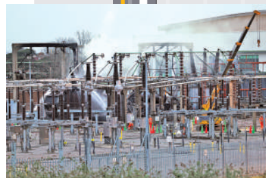
▲火災發生原因仍在調查中。