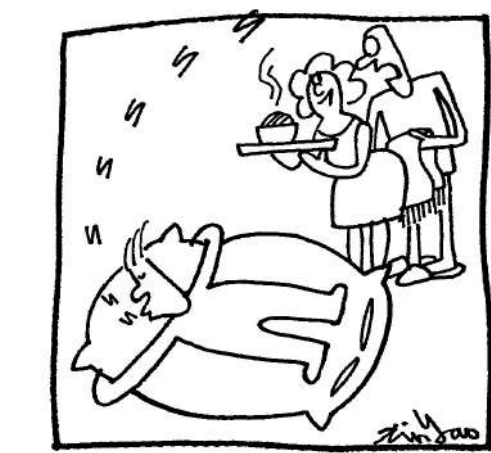
當你困倦的時候，枕頭比誰都親。

內地近年興起每集長約十五分鐘、總共十多集的短劇，據悉去年的市場規模便達五百億人民幣，令不少原本拍攝足本劇集的創作團隊，爭相轉投短劇行業。然而，短劇的質素參差不齊，內容千奇百怪，容易引起觀眾詬病。歸根究底，優質故事劇本和拍攝手法，方能保證劇集水準，進一步便可獲得投資和利潤。近期的電視劇《180天重啟計劃》，沒有特別噱頭，可是劇本和拍攝方式，令觀眾回味無窮，能夠引發共鳴，不落俗套。藉着豆瓣閱讀連載小說作為改編