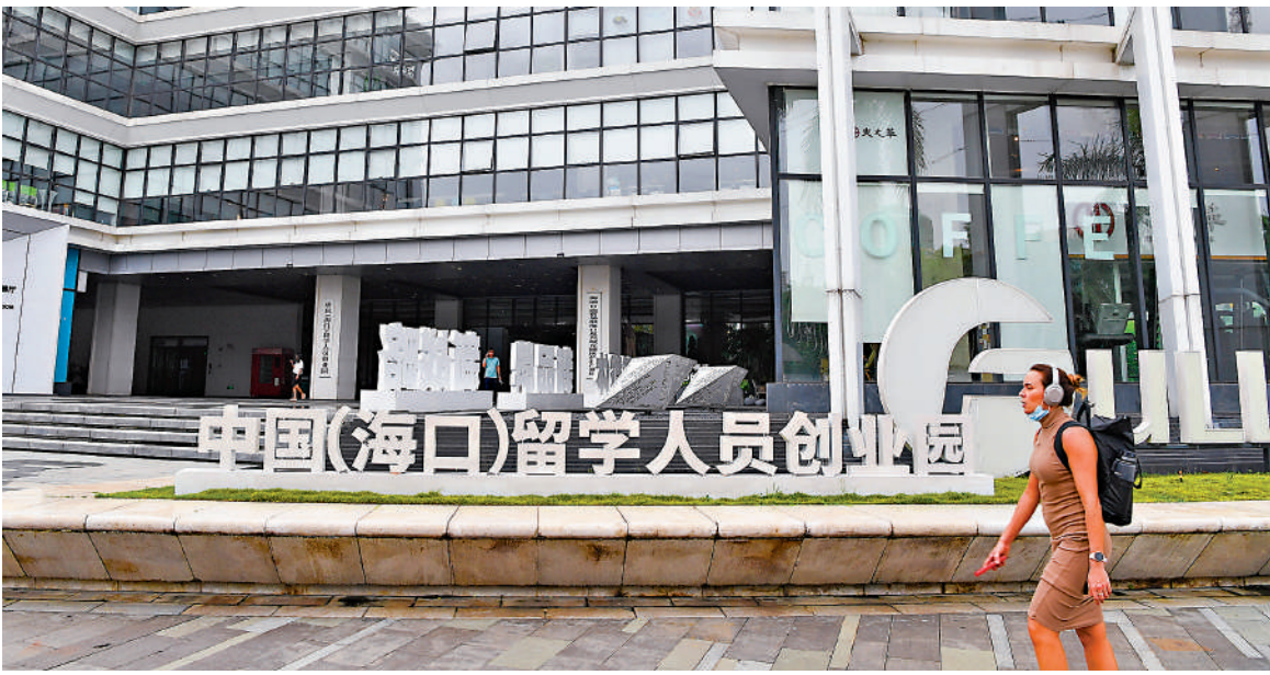
▲香港與海南自由貿易港在醫療、綠色經濟、創新資源、文化旅游、高端服務、以致教育事業等方面都有龐大的合作空間。