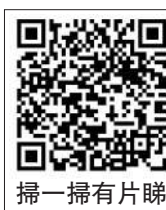
▲野豬晚上在田灣街頭踱步。