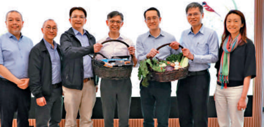
▲漁護署署長黎堅明（中）表示，計劃落實建立本地漁農產品統一新品牌。

漁護署相信，新品牌在市場上會有一定優勢，能夠吸引關注食品質素的市民購買，並期望未來能夠將本地優質漁農產品，推廣至大灣區及內地其他市場。 漁護署去年興建並開放了紅花嶺郊野公園、北大嶼海岸公園等多個公園，並落實「農+樂」農場計劃，推動本地休閒農業發展。漁護署稱，將繼續開拓生態旅遊，協助落實「香港旅遊業發展藍圖2.0」，完善郊區旅遊配套，包括優化現有設施、設立開放式博物館、推展樹頂歷奇活動等。 漁護署稱，將於三寶樹濕地保育公園興建生態友好旅舍，形式上將區別於普通酒店，預期優化措施能夠在不抵觸保育需要的前提下，讓郊遊人士有更豐富多樣的體驗。