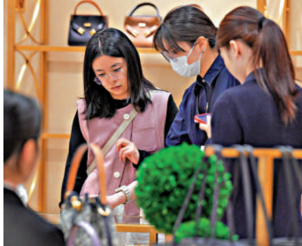
免稅店選購免稅商品。

26日發布的《關於支持國際消費中心城市培育建設的若干措施》提到，要更好發揮免稅店和離境退稅政策作用。落實市內免稅店政策，推動已批准設立的市內免稅店盡快完成建設並營業。鼓勵國產名特優新產品、國貨「潮品」進市內免稅店和口岸出境免稅店銷售。