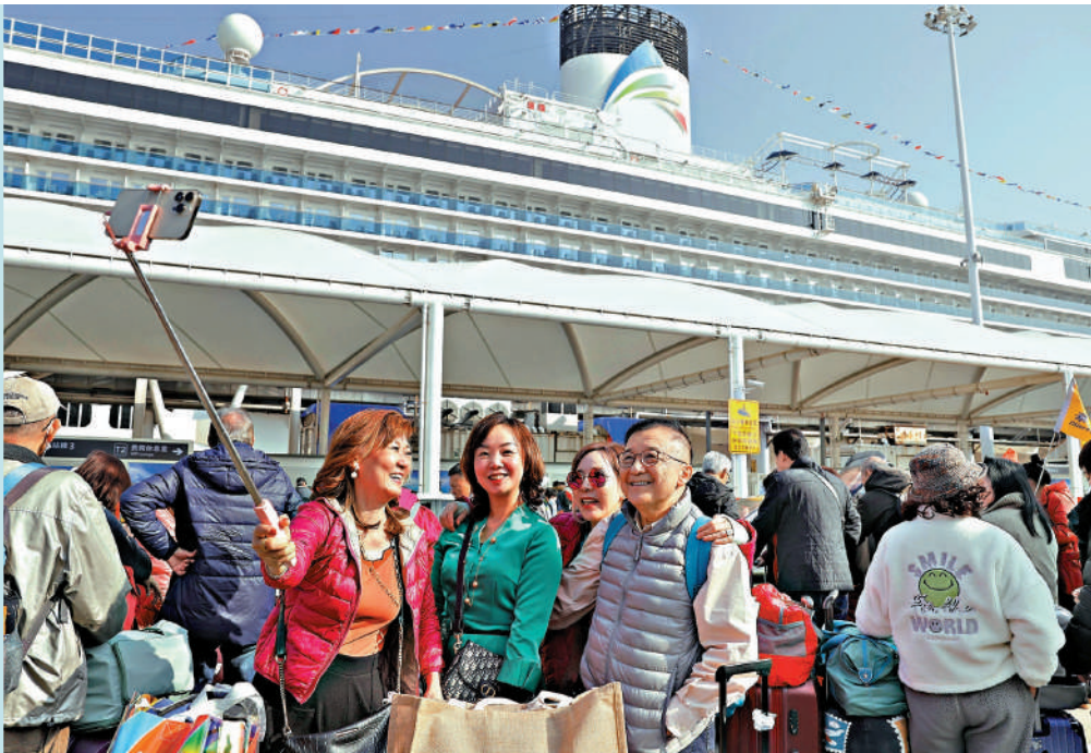
▲《措施》提到，將打造一批全球新品首發地標，完善首發經濟生態鏈。圖為中國首艘大型國產郵輪「愛達·魔都號」商業首航，新加坡旅客合影留念。