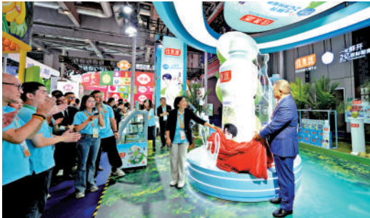
▲在第七屆進博會食品及農產品展區，一款新飲品首發亮相。

白明特別提到，《措施》中選取的五個城市，正是基於其經濟基礎、國際化程度和區域輻射力。「讓它們做先行先試的引領者，打好基礎後可以在全國起到推廣示範作用。」他認為，未來，隨著試點城市在服務水平、營商環境等方面持續突破，將有望在全國範圍內推廣、打造具全球影響力和本土特色的國際消費中心，既為提振消費注入活力，也為全球經濟發展貢獻新動能。