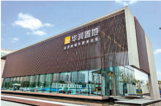
▲華潤置地新增投資重點布局一二線城市，佔比94%，其中北上廣深杭等核心城市佔72%。

復星醫藥自主研發的創新藥抗PD-1單抗漢斯狀是全球首個獲批的一線治療廣泛期小細胞肺癌的抗PD-1單抗。他透露，已在中國、歐洲、東南亞等30多個國家獲批上市。在乳腺癌、胃癌等領域，該公司自主研發的單抗生物類似藥漢曲優，已在50多個國家和地區獲批上市。