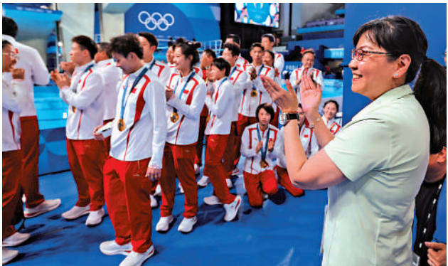
8枚金牌。▲周繼紅（右）去年曾率領國家跳水隊於巴黎奧運會包攬跳水全部

2020年1月，中國跳水協會在北京成立，周繼紅當選協會主席。2021年6月，周繼紅當選國際泳聯副主席，成為國際泳聯歷史上第一位女性副主席。2023年，周繼紅出任游泳運動管理中心主任。周繼紅將中國跳水隊打造為名副其實的「夢之隊」，培養了郭晶晶、吳敏霞、陳若琳、曹緣、全紅嬋、陳芋汐等多位奧運冠軍。她率隊斬獲46枚奧運金牌，並在2024年巴黎奧運會上首次實現包攬全部8枚金牌。