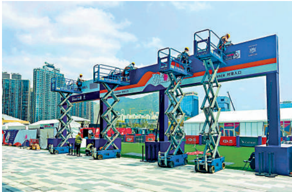
▲球迷村的布置已進入最後階段。

港大球場舉行時，充滿派對氣氛的「南看台」國際知名，鄧竟成表示主辦方會將大球場的「南看台」文化帶入啟德主場館，球迷可在欣賞比賽的同時於「南看台」購買酒精飲品，並透過主場館玻璃觀賞維港夜景。