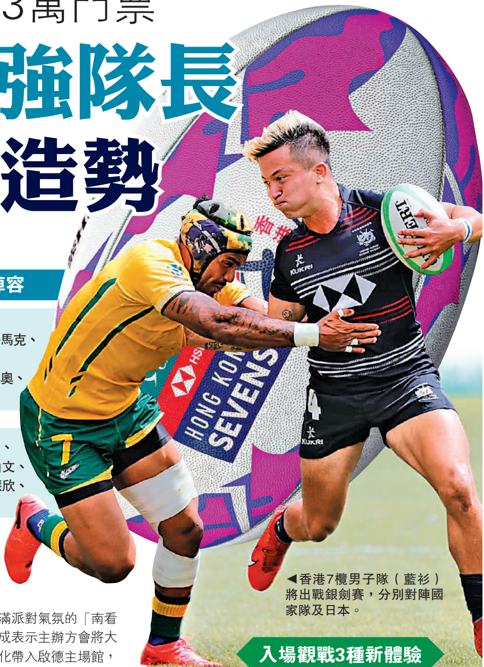
▲香港7欖男子隊（藍衫）將出戰銀劍賽，分別對陣國家隊及日本。