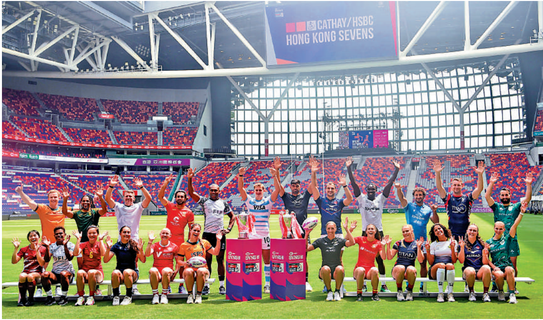
▲24支代表隊隊長在球場內合影。