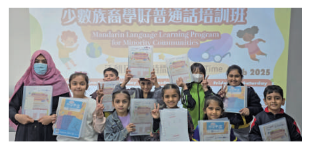
▲少數族裔學生設計普通話課程順利舉辦，學生們表示收穫滿滿。