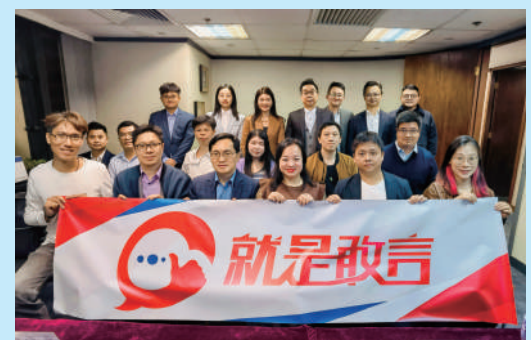
▲分享會現場氣氛熱烈，大家相互交流學習體會。

多位與會青年及「就是敢言」成員亦從自身行業及從業經歷出發，分享了兩會期間的工作及學習體會，現場交流及討論氛圍熱烈。據悉，是次分享會是《敢言者說》第九期主題活動，該項系列活動旨在為香港青年提供表達灼見和建言獻策的平台，以鼓勵更多青年深入了解並積極參與香港社會的各項公共事務，共創共建具有建設性的青年交流平臺。