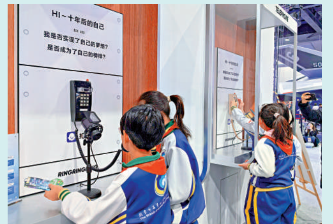
▲2025中國科幻大會現場，小觀眾通過AI與未來的自己「對話」。