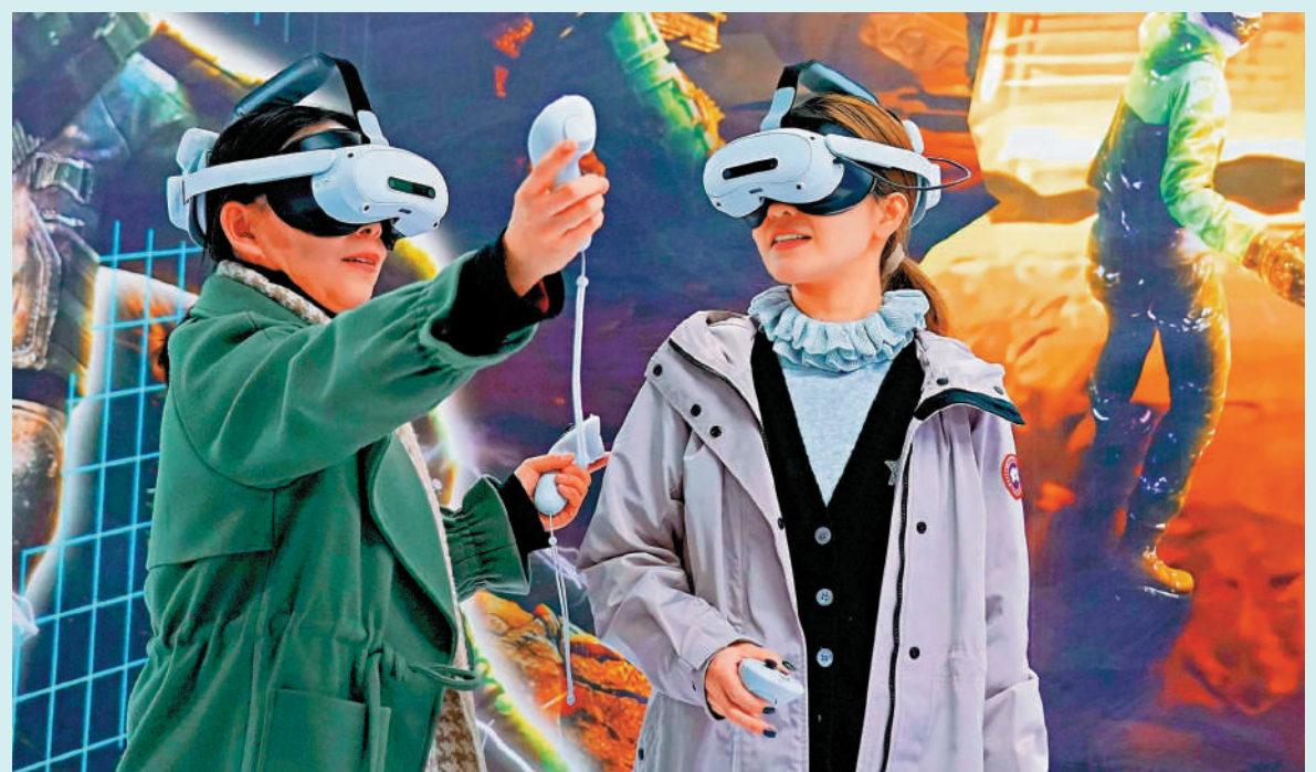
▲28日，2025中國科幻大會開幕式在北京首鋼國際會展中心舉行。參觀者在「幻眼·多維宇宙」沉浸式科幻展中體驗。