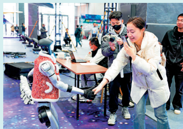
▲在本屆中國科幻大會會場，觀眾與人形機器人握手互動。