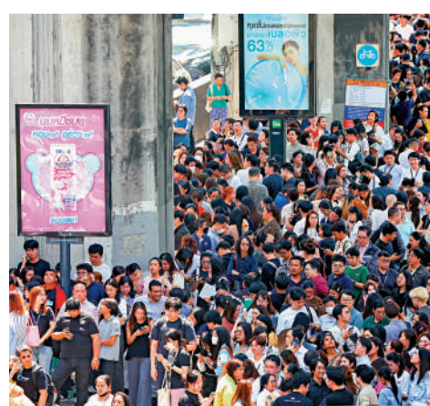
▲曼谷街頭擠滿了避難的民眾。