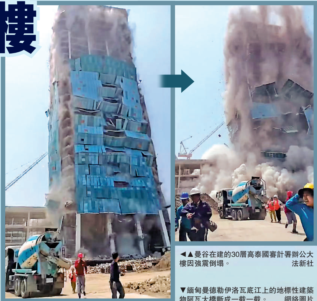
▲曼谷在建的30層高泰國審計署辦公大樓因強震倒塌。