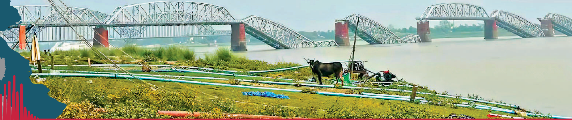
▼緬甸曼德勒伊洛瓦底江上的地標性建築物阿瓦大橋斷成一截一截。