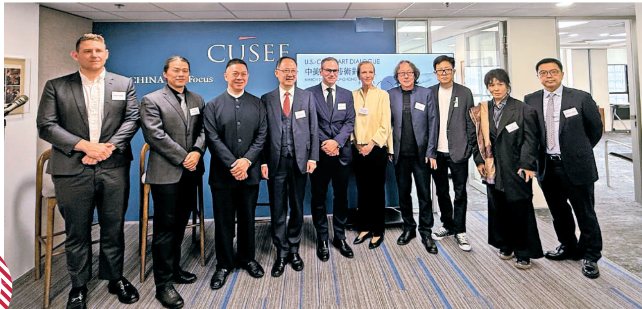
▲多位中美藝術家齊聚香港，參加首屆「中美青年藝術對話」。