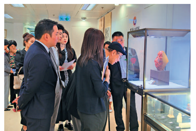
▲來賓參觀麻雙鳴玉石雕藝術香港品鑒雅集。