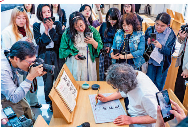
▶徐冰在「英文方塊字書法」展覽上展示書寫「英文方塊字」。

第三場討論聚焦於如何通過藝術加深對不同文化的理解。跨文化藝術交流幫助人們更好地理解彼此，從而促進中美之間的合作。諾亞·霍洛維茨談到：「讓美國人和中國在同一層面上理解對方是非常重要的。我欣賞中國的文化，並相信它能建立這種聯繫。」他續指，許多藝術機構和畫廊（舉行的國際展覽），包括巴塞爾藝術展，能夠推動彼此藝術市場的互動與融合，從而促進更深入的交流與合作。