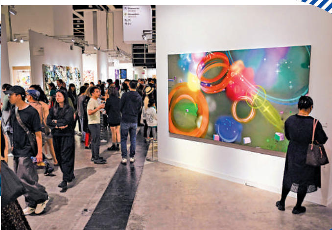
▶正在舉辦的巴塞爾藝術展吸引遊客。