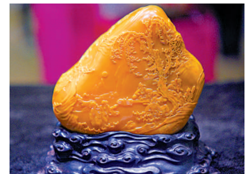
◀《延年益壽》（田黃石雕刻）。

【大公報訊】大公文匯全媒體記者小凡報道：中國工藝美術大師麻雙鳴玉石雕藝術香港品鑒雅集昨日在中環中心舉行，一眾嘉賓到場參觀品鑒，麻雙鳴亦介紹其作品和創作故事。