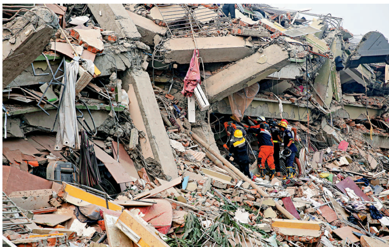
救援人員30日在緬甸曼德勒一棟倒塌建築中搜救倖存者。

緬甸發生7.9級大地震，此後餘震不斷，截至30日已造成緬甸全國約1700人遇難；泰國曼谷亦被強震波及，至少18人遇難。緬甸反政府武裝宣布30日起實施為期兩周的部分停火，以便開展抗震救災工作。國際救援隊伍已奔赴災區。但由於通訊和交通受阻，緬甸多地仍面臨缺乏救災設備和物資的問題，在緬甸第二大城市曼德勒，街道上瀰漫着「死亡的氣息」，隨時可能發生的餘震也影響救援行動。