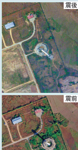
▶內比都國際機場的空中交通管制塔倒塌。