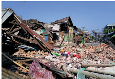
▲緬甸內比都在地震過後，滿街見到倒塌的樓宇。

入境處會繼續與外交部駐港特派員公署、相關中國駐當地使領館、旅遊業監管局等保持緊密聯繫，密切留意事態發展。