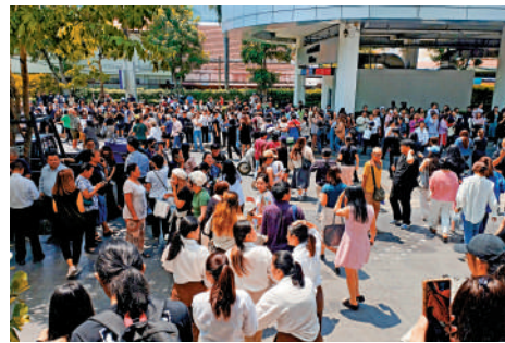
▲緬甸日前大發生地震，毗鄰的泰國亦有強烈震感，大批市民及旅客到街上暫避。