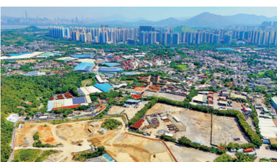
▲特區政府加速北部都會區發展，未來5年將擴大發債規模。

陳茂波續稱，特區政府的債券一向受機構投資者歡迎，近年亦有發行零售債讓市民認購，希望向市民提供穩健投資渠道之餘，亦能增強社會大眾對大型項目的認知與支持。