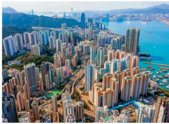
▲隨着利率趨向穩定甚至開始減息，置業意欲將會回升。