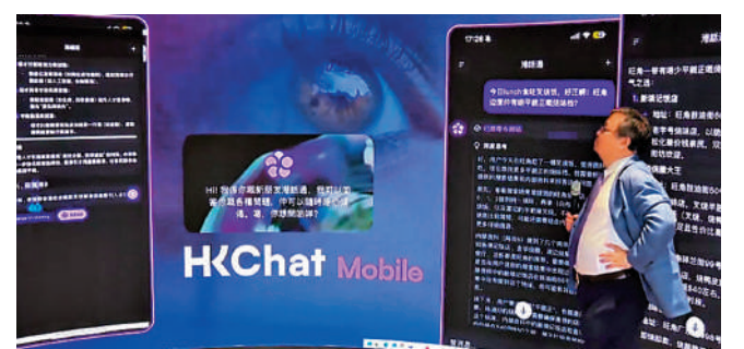
▲特區政府致力發展AI，以作關鍵產業。圖為香港首個AI大模型上月面世。