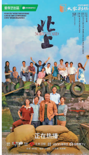
▲電視劇《北上》再現大運河畔的市井煙火。