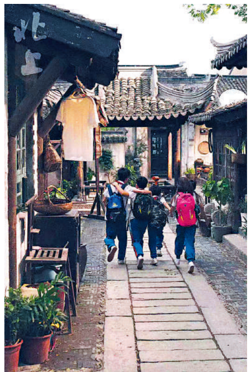
▲電視劇《北上》中的花街小院生活氣息濃郁。