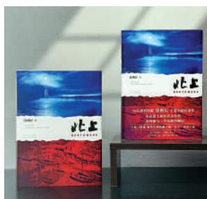
▲2024年《北上》新版上市。

總導演姚曉峰指出，拍攝《北上》時劇組基本上快把大運河跑遍了，大運河的独特魅力不只是記錄了「90後」一代成長、走向社會的心路歷程以及新時代的萬千氣象，更是對歷史、文化、人性的深度探索，「拍運河，就是拍中國人的流動史詩，讓觀眾觸摸「活着」的運河文化記憶。」