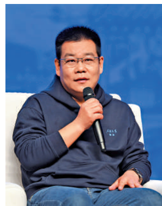
▲茅盾文學獎獲得者徐則臣。

1978年生於江蘇東海，畢業於北京大學中文系，《人民文學》雜誌主編。著有《跑步穿過中關村》《如果大雪封門》《北京西郊故事集》《耶路撒冷》《北上》等，其中長篇小說《北上》獲第十屆茅盾文學獎。