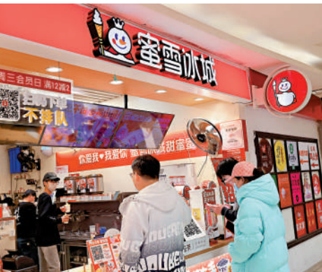
▲香港首季IPO成績亮眼，茶飲品牌蜜雪冰城獲超購5258倍，成為「凍資王」。

十大IPO（按募資額計算）主要集中在信息技術、媒體及電信行業。儘管面臨貿易關稅和利率不確定性，全球投資者對AI及其發展前景仍持樂觀態度。