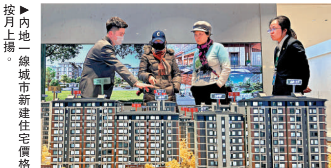
按月上揚。一線城市新建住宅價格