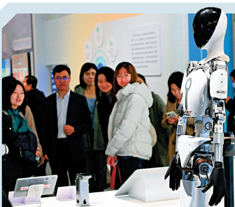
▲內地通過金融手段促進科技發展，加快建設「科技強國」。

《實施方案》明確主要目標：未來5年，銀行業保險業加快構建同科技創新相適應的金融服務體制機制，科技金融制度逐步健全，專業化服務機制、產品體系、專業能力和風控能力不斷完善，外部生態體系持續發展，科技信貸和科技保險擴面、提質、增效，為科技創新重點領域和薄弱環節提供更加精準、優質、高效的金融保障，加快實現科技金融高質量發展。