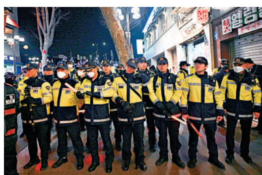
◀韓國民眾1日在首爾舉行反對尹錫悅的抗議示威，大批警察出動維持秩序。

另外，尹錫悅親信、其競選團隊秘書室長張濟元3月31日晚被發現在首爾家中身亡，警方稱「未發現他殺嫌疑」，目前正調查其死因。張濟元2015年擔任釜山某大學副校長時，因涉嫌性侵犯他當時的秘書被起訴，但他全盤否認指控。該秘書原計劃1日召開記者會。