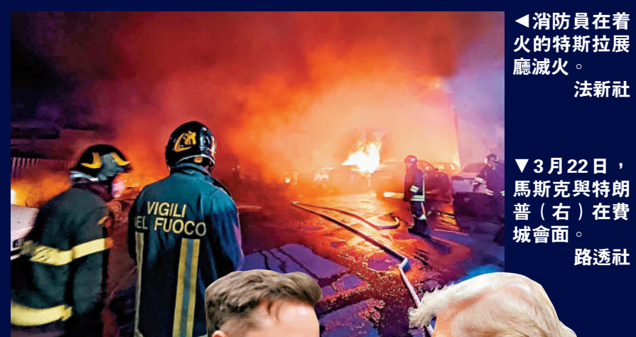
◀消防員在着火的特斯拉展廳滅火。