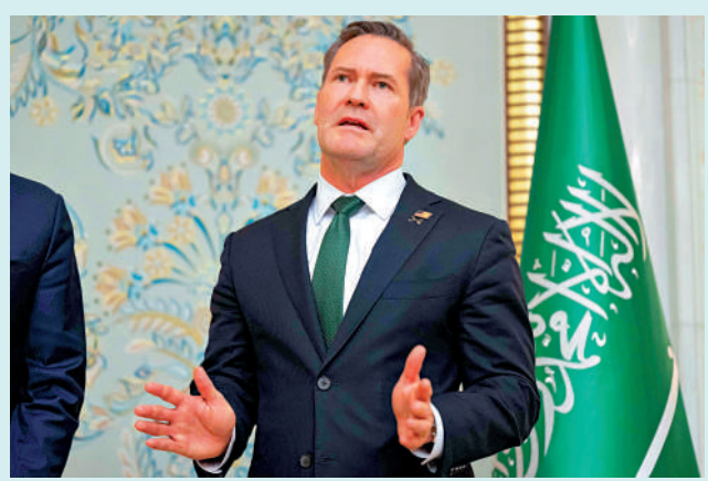
▶白宮稱美國總統國家安全事務助理華爾茲將繼續任職。

「群聊門」曝光後，事件持續發酵。美國國會參議院軍事委員會成員要求五角大樓就政府官員使用Signal軟件討論敏感軍事行動一事展開調查。3月25日，華爾茲接受採訪時回應說，這件事「很尷尬，我負全責」。當時有媒體稱，華爾茲可能將因此事引咎辭職。