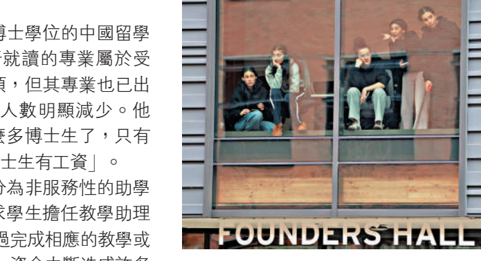
▲特朗普實施削減科研經費等措施，令美國學生和校方都感到擔憂。

美國大學博士獎學金主要分為非服務性的助學金和服務性的獎學金，後者要求學生擔任教學助理（TA）或研究助理（RA），通過完成相應的教學或研究工作獲得薪資。Hoffy表示，資金中斷造成許多專業的TA崗位數量減少。