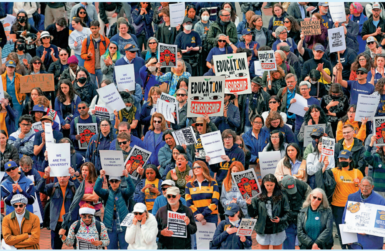
▲學生及教職員工3月19日在加州大學伯克利分校示威，抗議特朗普打壓學術界。

特朗普下令削減聯邦科研經費，並簽署行政令推動關閉教育部，導致全美多所高校資金中斷，其中博士項目是重災區。華盛頓大學3月9日宣布，「聯邦層面前所未有的快速政策變化」增加了資金削減的風險，校方已開始節約資金，包括凍結招聘和取消非必要的旅行